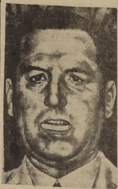
El general don Juan Domingo Perón, Presidente de la Argentina