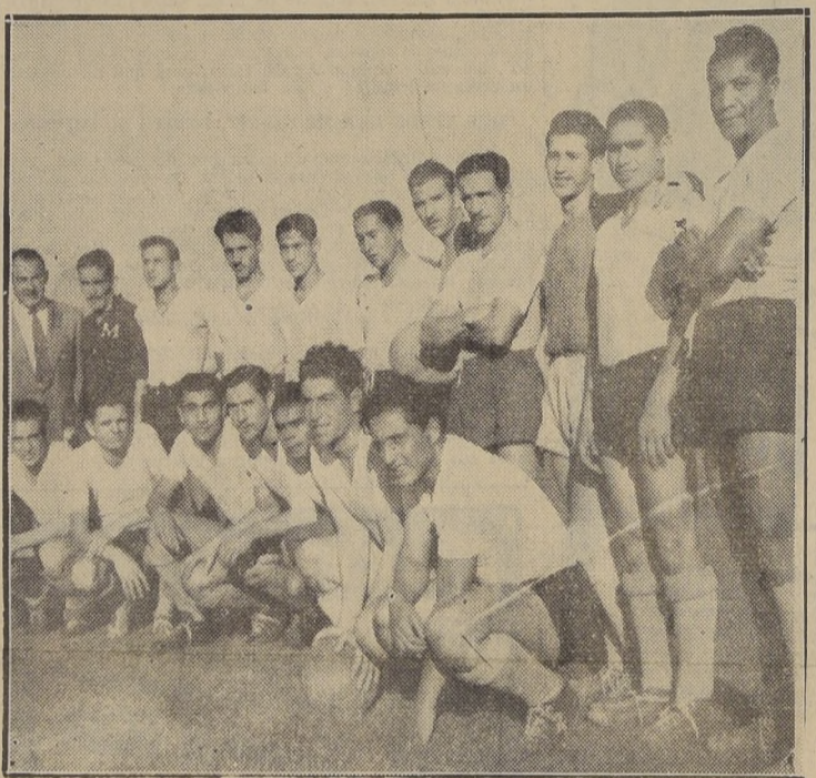
SIGUE PREPARANDO SU EQUIPO.— Como en años anteriores, el Magallanes ha realizado, ahora una serie de partidos de carácter amistoso, con el objeto de preparar al cuadro que actuará en el campeonato profesional de fútbol.— En el grabado aparece el team albiceleste con sus nuevas adquisiciones.

ANIMADO, el consejo directivo en la mencionada sesión procederá a sortear el programa de partidos correspondiente al torneo de reserva que comenzará el 17 del actual, y fijará las 15.15 y 13.15 como hora de iniciación de los partidos de primera división y tercera preliminar de primera, respectivamente.