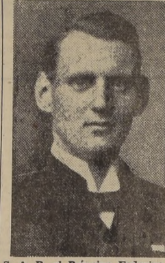
S. A. R. el Príncipe Federico