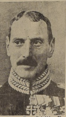
S. M. el Rey Christian X