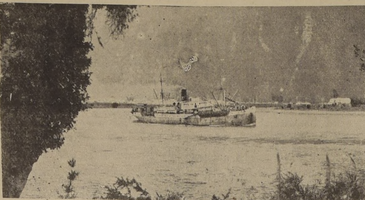
El río Aysén será dragado para facilitar la navegación.

PUERTO MONTT, 8.— El Gobierno ha encargado con especial interés los trabajos de dragado del Río Aysén, y al efecto, el Departamento de Puertos ha encomendado ya la iniciación de tales faenas.