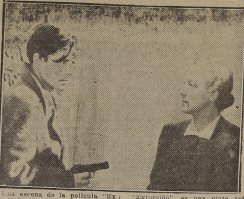
Una escena de la película 'Extorsión', que protagoniza el astro británico James Mason...