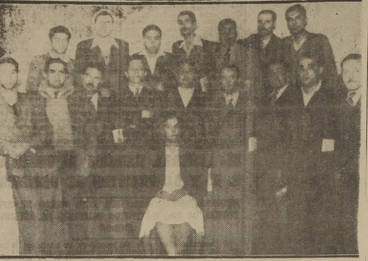
Grupo de delegados de provincias que participaron en el Congreso Nacional celebrado recientemente en esta capital por el gremio de suplementeros.

HOY SE REUNE EL GREMIO PARA DAR A CONOCER LAS CONCLUSIONES DEL CONGRESO Y EL PLAN DE TRABAJOS A REALIZAR