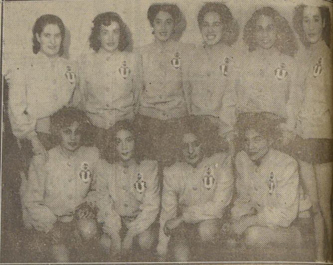
La "U"— Conjunto seleccionado de la Asociación Universitaria que en ningún momento fué un adversario de cuidado para el experimentado cuadro de Santiago