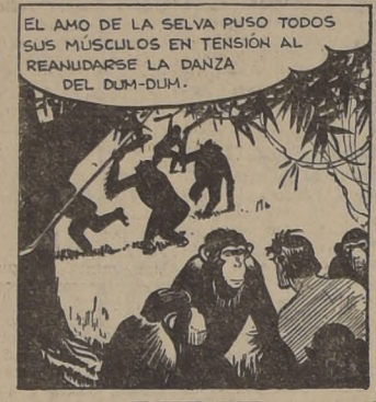
EL AMO DE LA SELVA PUSO TODOS SUS MUSCULOS EN TENSION AL REANUDARSE LA DANZA DEL DUM-DUM.