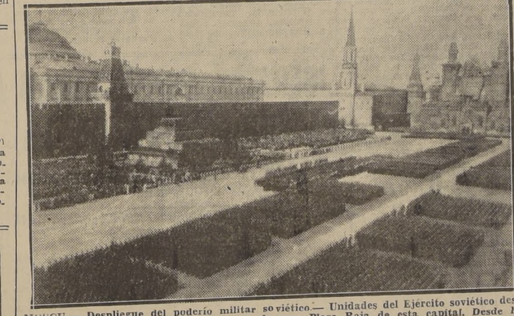
MOSCU. — Despliegue del poderío militar soviético. — Unidades del Ejército soviético desfilan frente a la tumba de Lenin, en la famosa Plaza Roja de esta capital. Desde la tumba de Lenin, a la izquierda, el Generalísimo Stalin pasó revista a sus tropas.