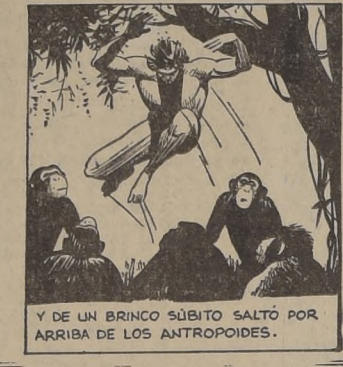
Y DE UN BRINCO SÚBITO SALTÓ POR ARRIBA DE LOS ANTROPÓIDES.