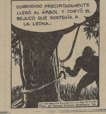
CORRIENDO PRECIPITADAMENTE LLEGO AL ÁRBOL Y CORTÓ EL BUEJICO QUE SOSTENÍA A LA LEONA.