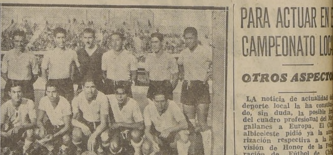
MAGALLANES.— Ha causado expectación la noticia de que el equipo chileno albeiceste irá a Europa. Sin embargo, nada hay de concreto todavía.