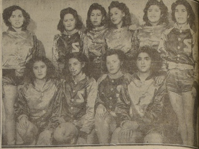
SEWELL.— Gran satisfacción les produjo a las representantes del mineral su justo fo sobre Rancagua. Era un "clásico" de la zona. El score alcanzó a 23-14