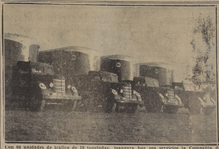
Con 60 unidades de tráfico de 10 toneladas, inaugura hoy sus servicios la Compañía de Transportes Combinados.

COMPRAS URGENTES, POR CUENTA AJENA. JOYAS, ORO, PLATINO Y OBJETOS DE ARTE PAGA LA MAS ALTA POTENCIACION ALAMEDA BERNARDO O'HIGGINS 1017