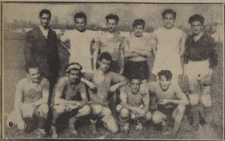
Equipo de Ingeniería, que en la primera fecha del torneo universitario, venció al elenco de Leyes.