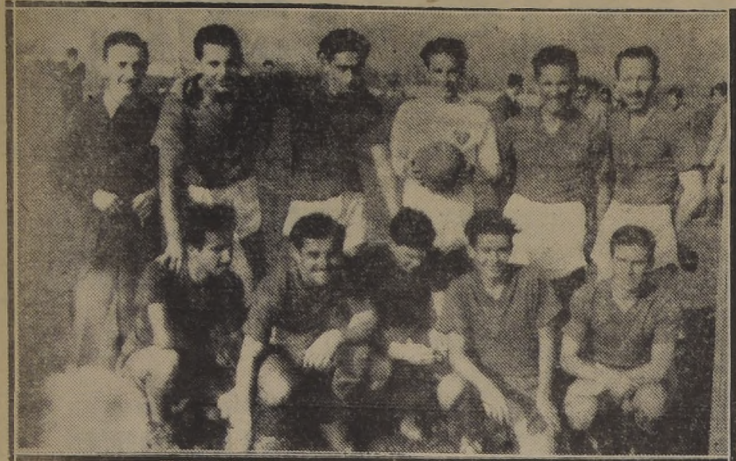
Conjunto de la Escuela de Leyes, que perdió por 5 a 2 con Ingeniería por el certamen de fútbol.