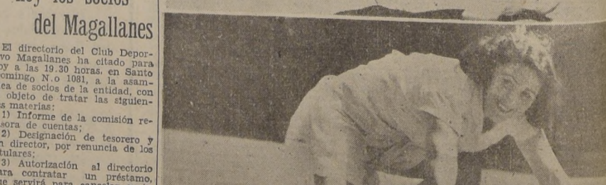
Reunión tienen hoy los socios del Magallanes