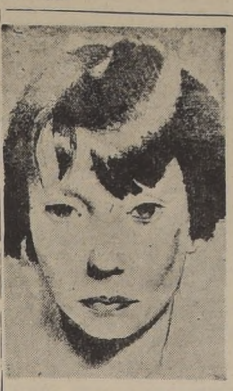
Nació como alma de artista, y ha vivido martirizada en la pintura.

Arrancada de un cuento de hadas y transportada brusca-