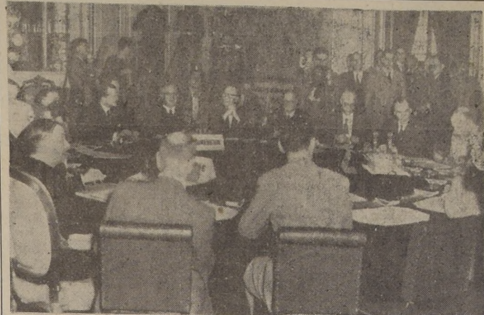
PARIS.— Conversaciones sobre el Plan Marshall.— Miembros de las delegaciones de Rusia, Gran Bretaña y Francia, sentados en el salón principal del Ministerio de Relaciones Exteriores, al darse comienzo a las discusiones sobre el Plan de Rehabilitación de Europa, propuesto por el Secretario de Estado norteamericano, George C. Marshall.— A la izquierda está el Canciller francés Bidault; le sigue el Canciller británico Bevin, El Canciller Molotov está a la derecha, pero no es visible en la fotografía.

GINEBRA, 2.— (U. P.).— El Subsecretario de Estado norteamericano William Clayton dijo hoy en una conferencia de prensa que tanto el plan de Marshall como el acuerdo comercial mundial, que se está negociando en esta ciudad, seguirían adelante aun si Rusia no participa en ellos.