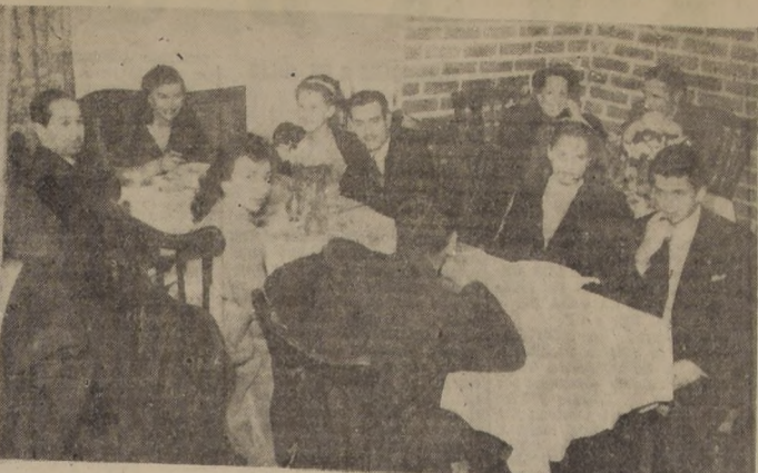
Aspecto tomado a la hora de comida en la Hosteria de Providencia, que como siempre, se ve prestigiada por una selecta concurrencia