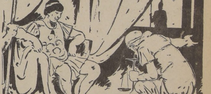
Médicos y estudiosos eran llevados a palacio y se les prestaban todas las facilidades para que estudiasen la acción de los venenos y contravenenos, con el mayor cuidado posible.

La farmacología adquirió entonces gran auge, apoyada por monarcas y príncipes, devotos de ella, donde veían el único modo de encontrar antidotos a los venenos con que sus vidas eran amenazadas a diario.