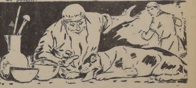
Mitridates VI, rey de Ponto, trató de inmunizarse contra la acción de los tóxicos, ingiriendo cantidades crecientes de veneno, e ideó un contraveneno que ensayó con éxito.