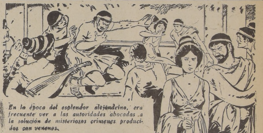
En la época del esplendor alejandrino, era frecuente ver a las autoridades abocadas a la solución de misteriosos crímenes producidos con venenos.

La farmacología adquirió entonces gran auge, apoyada por monarcas y príncipes, devotos de ella, donde veían el único modo de encontrar antidotos a los venenos con que sus vidas eran amenazadas a diario.