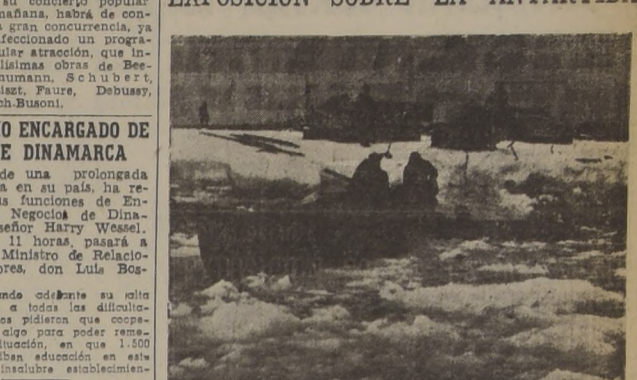
Muy interesante es la exposición que está abierta al público en el Ministerio de Educación, en donde se exhiben numerosas fotografías captadas por Hernán Carrera Rodríguez, durante la reciente Expedición al Territorio Antártico Chileno.