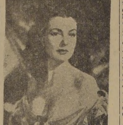
Patricia Roc, actriz inglesa, tal como aparece en su nueva película