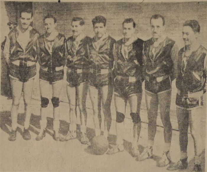
VENCIO CON HOLGURA. Quinteto superior de la Y. M. C. A., que anoche no necesitó dirigirse en recursos para alcanzar una fácil conquista sobre el Iberia por el score de 40-18.