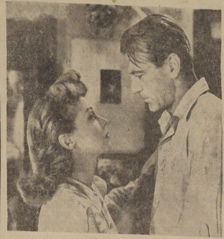
GARY COOPER Y LILLI PALMER