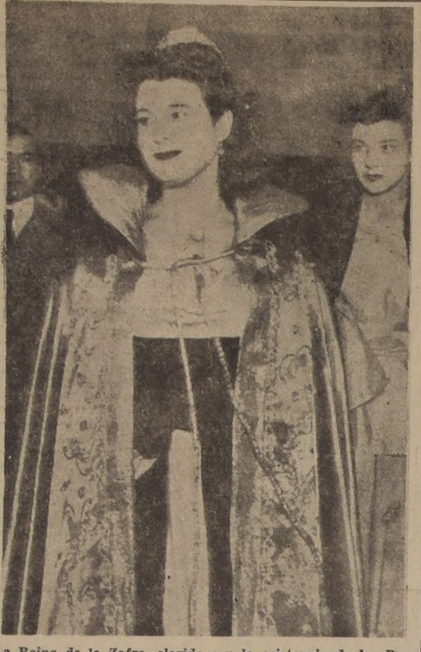
La Reina de la Zafra, elegida con la asistencia de los Presidentes Videla y Perón, en el Bosque 9 de Julio, de Tucumán