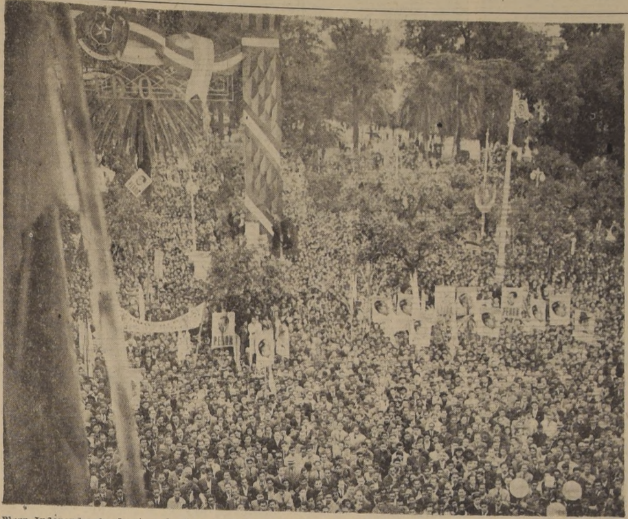
Plaza Independencia, frente a la Casa de Gobierno de Tucumán.— Durante la recepción que la enorme multitud ofreció a los Presidentes de Chile y Argentina, Excmos. señores Gabriel González Videla y Juan Domingo Perón