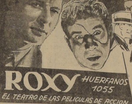
EL TEATRO DE LAS PELICULAS DE ACCION