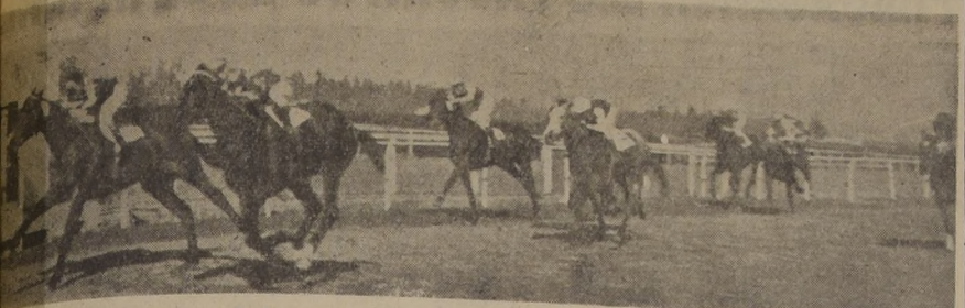
El fuerte avance de Ecusson en la tercera competencia de la tarde, abonando a sus apostadores un estado de preparación. La escolta esta vez Colpayo, que viene decayendo en su acción, después de un primer esfuerzo a la sigla del ganador, durante el recorrido. Cuarto en tardío avance llega Millarai precediendo a Roi Soleil y Hooligan, mientras el favorito Agalludo no se deja ver