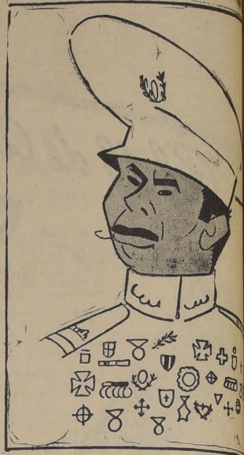
El Presidente del Paraguay, general Morúa, quien se ha tornado crítico con respecto a la política de las tropas antiparasitarias.