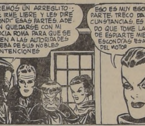
AHORA, HAREMOS UN ARREGLITO. PERMITANME IRME LIBRE Y LES DIRE DONDE ESCONDÍ ESAS PARTES. ADE MAS PUEDEN QUEDARSE CON MI QUERIDA SOCIA ROMA PARA QUE SE LA ENTREGUEN A LAS AUTORIDADES COMO PRUEBA DE SUS NOBRES INTENCIONES.