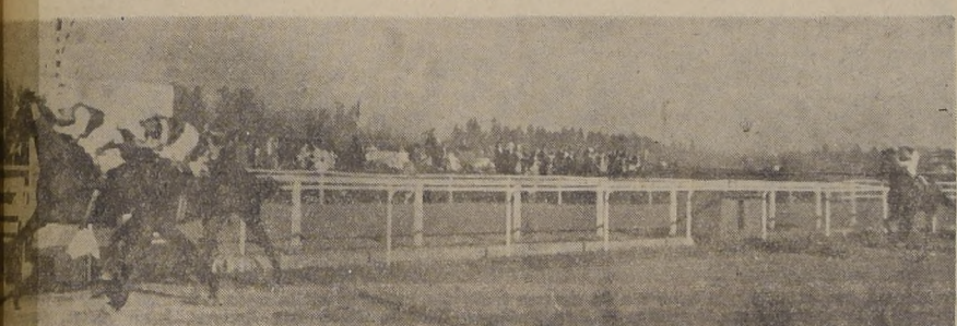
Rebenque se adjudica la otra serie condicional sobre Livingstone, que, mejorando sus anteriores, logra de sorprender con una disparada, en los comienzos del derecho. Tercera, lejos, quedó la gran favorita Valencia, que en su desempeño a la delantera, se entregó al menor aprión. Cuarto, Perdiguin, que parece volver en gran estado