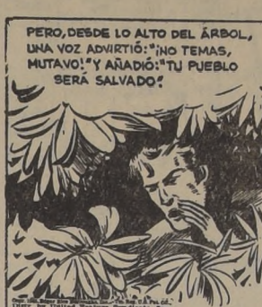
PERO, DESDE LO ALTO DEL ÁRBOL, UNA VOZ ADVIRTIÓ: "NO TEMAS, MUTAVO! Y AÑADIÓ: "TU PUEBLO SERÁ SALVADO!"