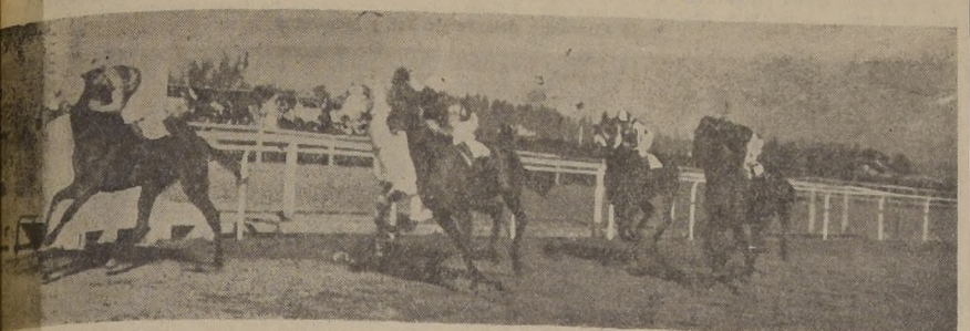
Se obtiene un nuevo y fácil triunfo en la mejor serie de los handicaps de 1.500 metros, demostrando hallarse en un estado de preparación. La escolta esta vez Colpayo, que viene decayendo en su acción, después de un primer esfuerzo a la sigla del ganador, durante el recorrido. Cuarto en tardío avance llega Millarai precediendo a Roi Soleil y Hooligan, mientras el favorito Agalludo no se deja ver