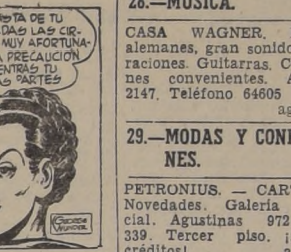
ESO ES MUY ESCOTA DE TU PARTE, TRECÓ DADAS LAS CIRCUNSTANCIAS ES MUY ACORTADO QUE TOMÉ LA PRECAUCION DE ESPERARTE MIENTRAS TU ESCONDÍAS ESAS PARTES DEL MOTOR.