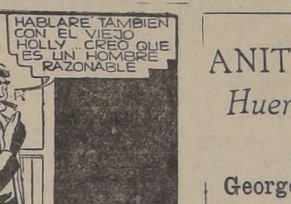
HABLARE TAMBIEN CON EL VIEJO QUE ES UN HOMBRE RAZONABLE.