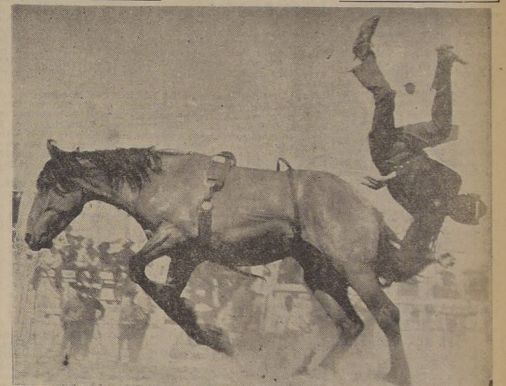
CALGARY (Canadá). — Se efectuó recientemente en esta ciudad un rodeo, cuyo principal número estuvo a cargo de los domadores venidos de todos los puntos del país. Se distribuyeron en premios 18 mil pesos, cantidad que seguramente no compensará los accidentes sufridos por los participantes. Hubo de todo.

Desde el herido leve, hasta el grave, y la gente, como de costumbre, se divirtió mucho.