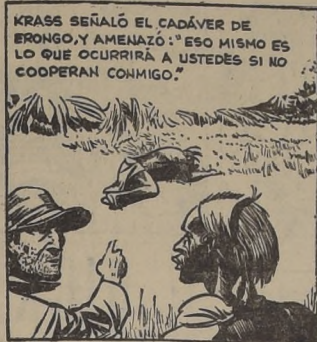
KRASS SEÑALÓ EL CADÁVER DE BRONCO, Y AMENAZÓ: "ESO MISMO ES LO QUE OCURRIRÁ A USTEDES SI NO COOPERAN CONMIGO."