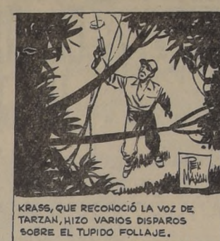
KRASS, QUE RECONOCIÓ LA VOZ DE TARZAN, HIZO VARIOS DISPAROS SOBRE EL TUPIO FOLLAJE.