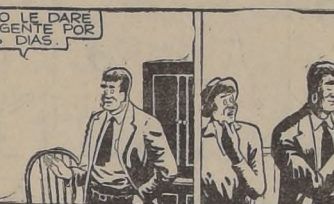
PERO LE DARE UNOS DIAS.