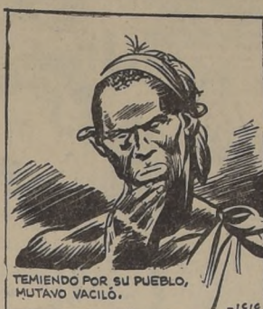
TEMRIENDO POR SU PUEBLO, MUTAVO VACILÓ.