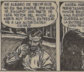
ME ALEGRO DE DECIR QUE NO ES TAN SIMPLE POR QUEERTE. ESCONDÍ UNA PARTE DE CADA MOTOR DEL AVION LES SERIA MUY DIFÍCIL ENTREGARME A LAS AUTORIDADES CHINA.