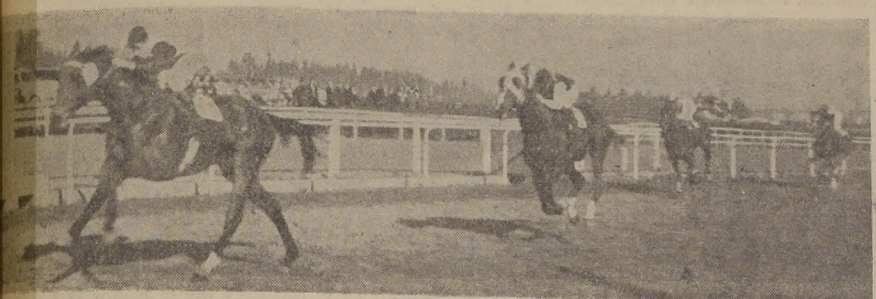
Rebenque se adjudica la otra serie condicional sobre Livingstone, que, mejorando sus anteriores, logra de sorprender con una disparada, en los comienzos del derecho. Tercera, lejos, quedó la gran favorita Valencia, que en su desempeño a la delantera, se entregó al menor aprión. Cuarto, Perdiguin, que parece volver en gran estado