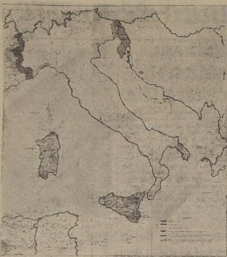
ROMA.— Este mapa nos muestra cuáles serán las nuevas fronteras de Italia una vez que entre en vigencia el tratado de paz. Este mapa fue elaborado por el Instituto Geográfico Militar Italiano. El Estado libre de Trieste aparece marcado en color blanco.