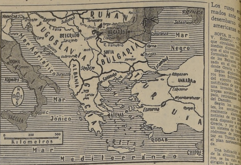
El comando ruso consultaría un repliegue hacia la línea del Danubio si estallara otro conflicto internacional que amenazara los Balcanes