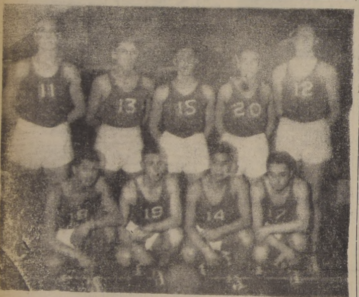
Representación de básquetbol de la Escuela de Carabineros.

INSCRIPCION GRATUITA Es nuestro deber informar a los interesados, que las inscripciones son absolutamente gratuitas, de manera que a los jóvenes aspirantes no les reportará gasto alguno el hecho de concurrir a la Asociación de Box, Mac Iver 464, donde se atenderá todas las tardes de 19 a 21 horas, inclusive hoy sábado. La Asociación ha acordado mantener abiertas los sábados, a fin de darle facilidades a todos aquellos jóvenes que por motivo de sus labores diarias, no pueden hacerlo los demás días de la semana.