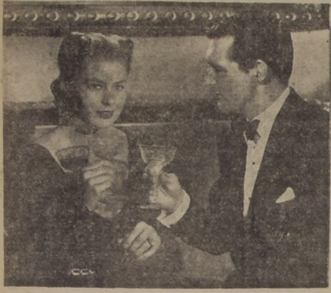
INGRID BERGMAN y CARY GRANT