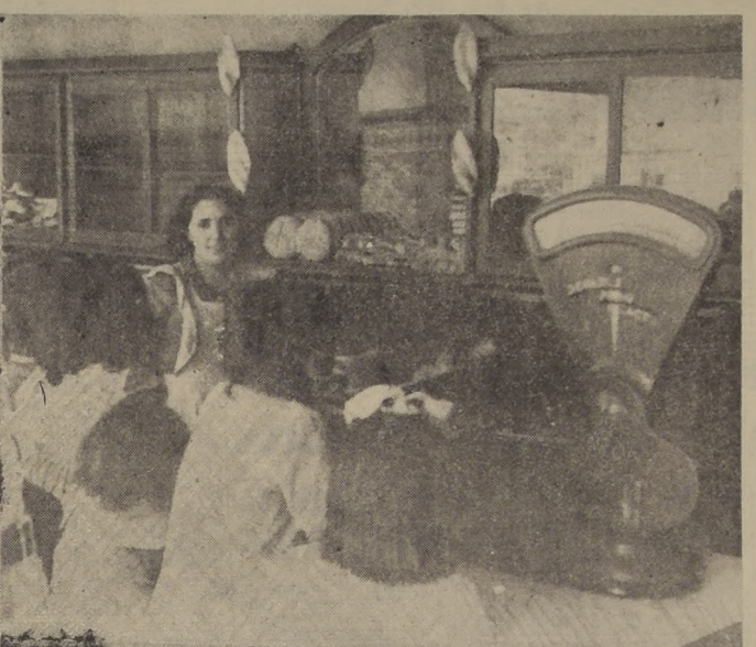
Nadie debe pagar más de $ 6.40 por el kilo de pan en la panadería, ni más de $ 8.00 a los reparadores y en los puestos de pan, fuentes de soda, etc. Tales son los precios oficiales, fijados por el Gobierno, precios que algunos industriales panaderos y especuladores no están dispuestos a respetar. Las autoridades piden que las dueñas de casa y todos los consumidores en general, denuncien las infracciones, para proceder con toda energía contra los infractores.

"Aunque parezca paradójico, en la actualidad el precio del pan a $ 6.40 resulta más barato que el que el público estaba comprando a $ 4.40, como pasará a demostrarlo: "En efecto, el precio oficial antiguo a $ 4.40 el kilo, era ilusorio en la práctica, porque el precio referido, sólo figuraba en el papel. Existía, como lo sabe el público, dos tipos de corte de pan: uno que era el oficial, y que correspondía al precio de $ 4.40 el kilo, y otro, llamado pan especial, que no se vendía al peso, sino por unidades.