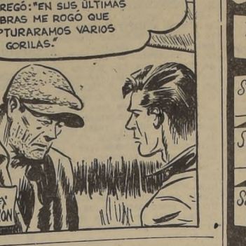
Y AGREGÓ: "EN SUS ÚLTIMAS PALABRAS ME ROGÓ QUE CAPTURÁRAMOS VARIOS GORILAS."