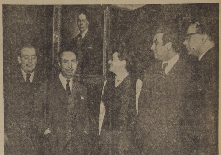
Marta Brunet fué para nosotros la mejor noticia. Llegó de sorpresa, con la curiosidad de quien vuelve a su hogar, a saber cómo están los suyos. La misma Marta de otros días, gentil, cariñosa, sonriente, interesada en todo, desde el complicado problema internacional, hasta la noticia casera, de tremenda trascendencia familiar. Nos habló de libros, películas, modas, filosofía, deportes. Ni siquiera desdénóarnos el último chiste de Corrientes y Florida. Pero a