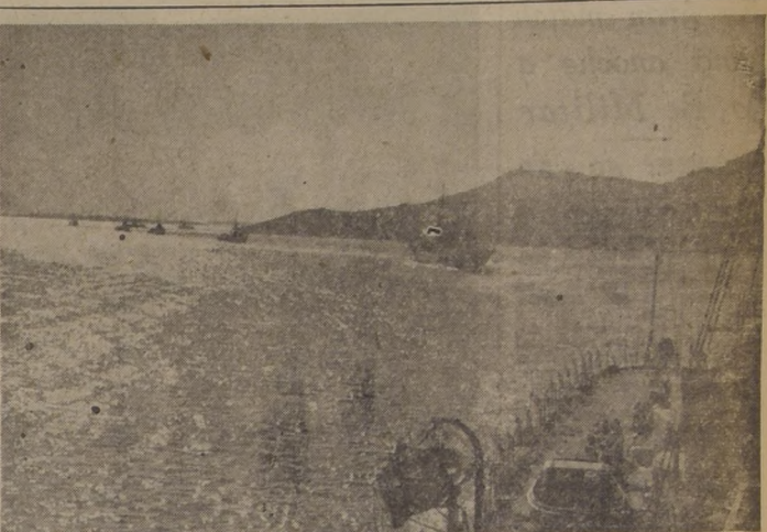
CERDEÑA. — La flota italiana se hace nuevamente a la mar. La flota italiana se ha hecho nuevamente a la mar, después de haber quedado muy reducida por el tratado de paz. La foto nos muestra a unidades de la otrora poderosa flota italiana, cruzando un estrecho en aguas de Cerdeña, durante las maniobras efectuadas la semana pasada. (FOTO ACME).

Brasil, principal país que firme protocolo de aranceles y comercio.