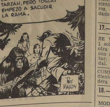
CURTIS CUMPLIÓ LA ORDEN DE TARZAN, PERO TOGLAT EMPEZÓ A SACUDIR LA RAMA.