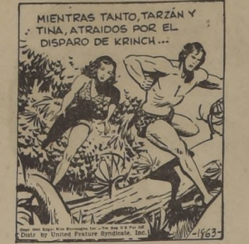
MIENTRAS TANTO, TARZAN Y TINA, ATRAIDOS POR EL DISPARO DE KRINCH...