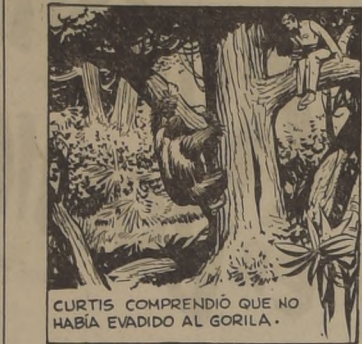
CURTIS COMPRENDIÓ QUE NO HABÍA EVADIDO AL GORILA.