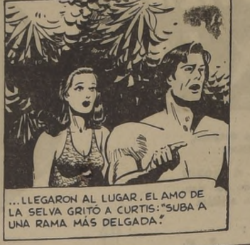
...LLEGARON AL LUGAR. EL AÑO DE LA SELVA GRITÓ A CURTIS: 'SUBA A UNA RAMA MÁS DELGADA.'