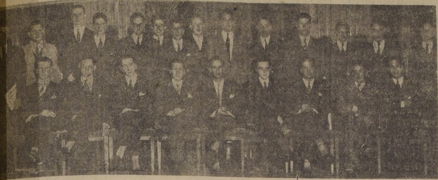
Egresados del 6.º año B, el año 1946, del Colegio de San Ignacio, se reunieron la noche del lunes en una comida que tuvo lugar en el Hotel Carrera.