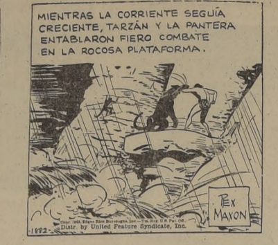
MIENTRAS LA CORRIENTE SEGUÍA CRECIENDO, TARZAN Y LA PANTERA ENTABLARON FIERRO COMBATE EN LA ROCOSA PLATIFORMA.