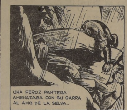
UNA FERAZ PANTERA AMENAZABA CON SU GARRA AL AMO DE LA SELVA.