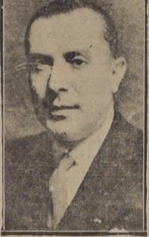
S. E. el Presidente de la República