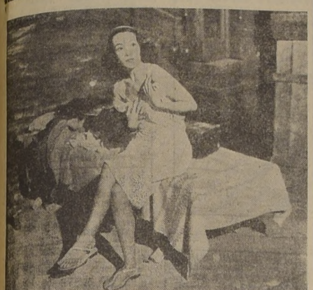
En la fotografía aparece Dolores del Río.

ARTURO DE CORDOBA Y DOLORES DEL RIO SE REUNEN EN UNA PRODUCCION