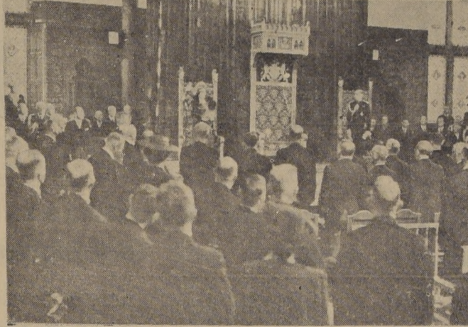
LA HAYA.—La foto nos muestra a la princesa Juliana en los momentos en que levanta su mano derecha prestando juramento como princesa Rejente de Holanda. A la derecha está el príncipe consorte Bernhard. Entre ellos está el trono que normalmente ocupa la Reina Guillermina, cuyo retiro temporal se debe al estado de su salud.