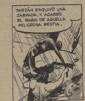
TARZAN ESQUIVÓ UNA ZARPADA Y AGARRÓ EL RABO DE AQUELLA PELIGROSA BESTIA.