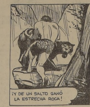
DE UN SALTO GANÓ LA ESTRECHA ROCA!