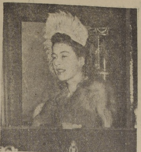
LONDRES.—La princesa Elizabeth mientras se dirige en el carruaje real al Parlamento para concurrir por primera vez a su inauguración como presunta heredera al trono de Gran Bretaña.—(ACME).

La Princesa Isabel asiste a la apertura del Parlamento