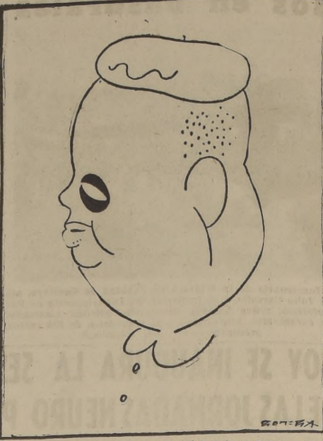
El conocido líder republicano español Indalecio Prieto, cuyas conversaciones políticas con Mister Bevin y Gil Robles han producido enorme expectación en España.