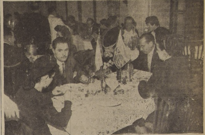
Aspecto de los comedores de la Hosteria Providencia, a la hora de comida