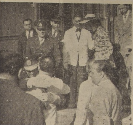
YACUIBA.— Los Presidentes argentino y boliviano, General Perón y doctor Hertzog, se abrazan, momentos después de llegar a esta ciudad el Primer Mandatario de Argentina.