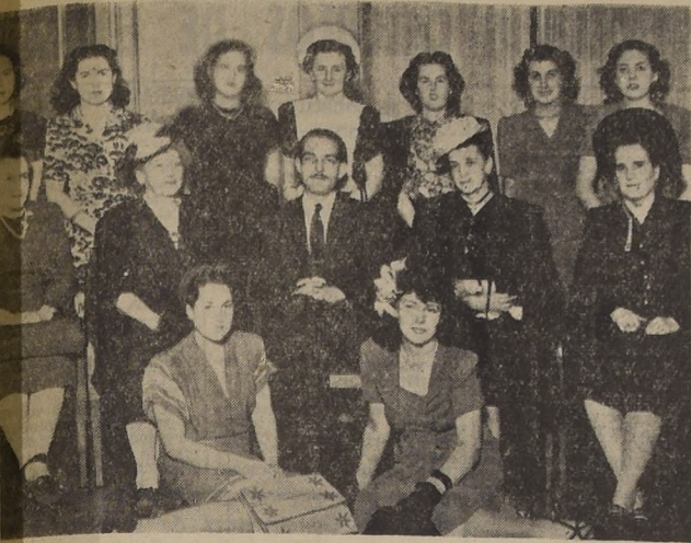
Presentación del coro "Santiago" a beneficio de la Pascua de los Niños Pobres.