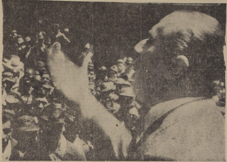
Su Excelencia habla a los mineros de Schwager, en la boca mina, demostrándoles que no ha habido actos de violencia de parte de las Fuerzas Armadas, y que su acción gubernativa se encaminará siempre hacia el bienestar de las clases trabajadoras.

Además, comprendemos que los mismos elementos, los comunistas, que quisieron entregar nuestra patria, nuestra libertad, nuestra soberanía, nuestra independencia, a esa nación extranjera, que están dispuestos a barrenar la producción, las faenas para enriquecer la recuperación económica de nuestro país, con el malsano propósito de dar lugar a la desesperación por el hambre, originando males antipatrióticos. Pero, como obreros, como hombres como chilenos, rogamos a Ud., señor Intendente, se sirva hacer llegar hasta S. E. el Presidente de la República que estamos dispuestos a defender tales maniobras, rindiendo homenaje a la soberanía de Chile, presidida por el Sr. Bernardo Ibáñez, y en compañía del diputado don Luis González Olivares, se entrevistó ayer tarde con S. E. el Presidente de la República. Fuimos informados de que se trató sobre asuntos de carácter social y económico de los trabajadores.