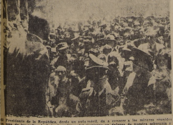
El Presidente de la República, desde un auto móvil, da a conocer a los mineros reunidos en una de las calles de Lota, la política del Gobierno en defensa de nuestra soberanía y del pueblo.