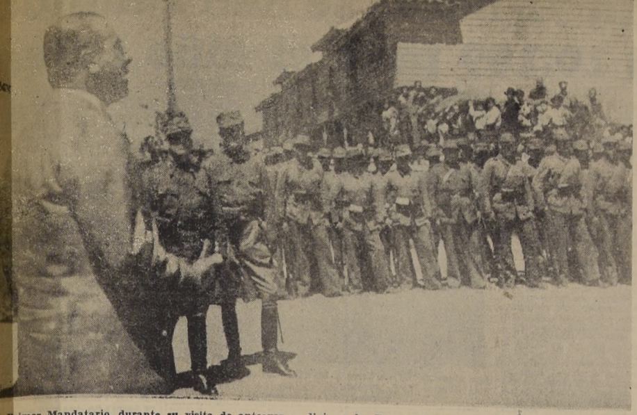
Primer Mandatario, durante su visita de anteayer se dirige a las Fuerzas Armadas de Schwager, elogiando su correcta actuación en el conflicto carbonífero.