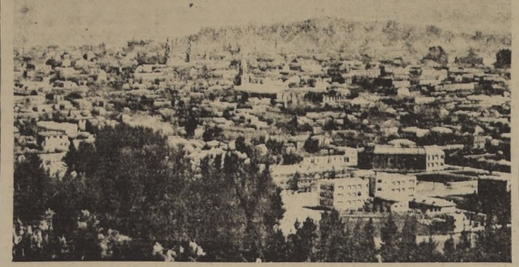
Vista panorámica de Concepción, ciudad en la que se efectuará la Segunda Convención Nacional de las Provincias.