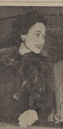
NUOVA YORK.— El Duque y la Duquesa de Windsor sonríen en la cubierta del "Queen Mary" a su llegada a Nueva York, el 11 del actual.

Una fuerza de 70 grupos contaría con 6.889 aeroplanos, incluso los de entrenamiento. Además, la Guardia Nacional Aérea tendría 3.212 aviones de combate, y el Cuerpo de Reserva de la Fuerza Aérea otros 2.360. En este total de 12.441 aparatos, Spaatz dijo que habría entre siete y ocho mil aeroplanos de combate de primera línea.