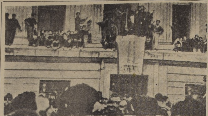
MARSELLA (Francia).— Manifestantes comunistas invadieron el Palacio de Justicia, mientras se juzgaba a cuatro miembros del partido, por haber instigado una manifestación anterior. Posteriormente, los manifestantes se apoderaron de la Municipalidad y golpearon al nuevo Alcalde de gaullista.