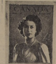
Canadá conmemorará el matrimonio de la princesa Isabel con una omisión especial de sellos de correo.