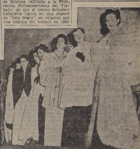
PARIS.—Una escena de la gran exhibición de pieles efectuada hace poco en el Palais de Chaillot. La foto nos muestra algunas de las hermosas modelos y los abrigos que lucieron.