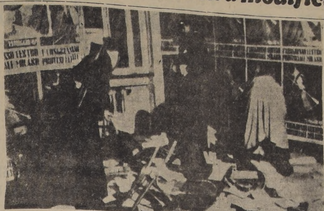
MILAN.—Carabineros examinan los destrozos causados en el diario del Partido L'Uomo chistas, como protesta por la muerte de un comunista durante un disturbio hace una semana.

... y Cuba adhiere a dicha moción. ... se opuso, aducien- ... Rusia no partici- ... en la Pequeña Asamblea.