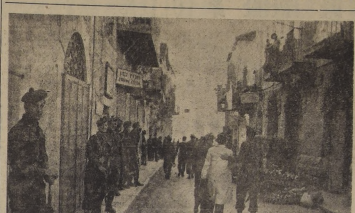
JERUSALEN. — Judíos detenidos en las primeras horas del alba, son conducidos a los cuarteles de policía por soldados británicos, en relación con un ataque con granadas en un café.

Fue aprobada por 25 votos contra 13, uno menos de la mayoría de los tercios requerida por la Asamblea