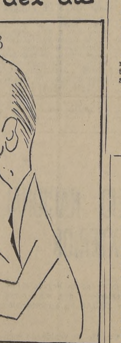
Raúl Mantecola, el notable artista chileno que figura en la delegación de dibujantes de Argentina.