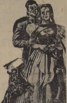
Un dibujo de Jorge Negrete y Charito Granados