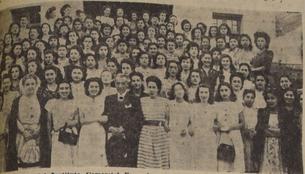
Los miembros del Instituto Comercial Femenino, ofrecieron un té de despedida al Sexto Año, en el Stade Francais.

Por hoy voy a ayudarlas dándoles informaciones de donde se pueden comprar las medias. Las medias de las mujeres son el peor quebradero de cabeza de los hombres, porque son muy frágiles. Las tales medias Nylon que aseguran que duran seis meses no han resuelto el problema porque las señoras y señoritas las rompen con las uñas largas al subírselas. De paso les informamos que las medias que están haciendo furor son las de color humo, y no las de color carne.