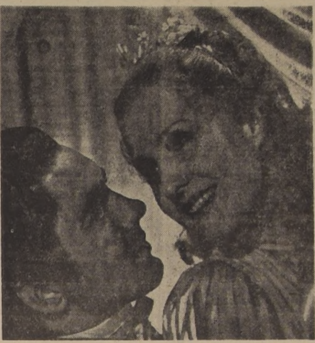
REPITEN UN EXITO. Norma Shearer y Tyrone Power son las estrellas que aparecen en el grabado y que protagonizan el drama "María Antonieta", que desde ayer se está exhibiendo en el Teatro Metro, donde ha conseguido un amplio éxito.