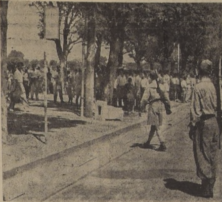
RANGKOK (Siam).—El Ejército coopera a la revolución sin sangre en Siam. Guardias del Ejército mantienen a los civiles alejados del Ministerio de Defensa, que fue utilizado como cuartel general a raíz del golpe de Estado de Luang Phibun Songkram.

Schuman anunció que el Gobierno tomará nuevas medidas para elevar los subsidios familiares y reclasificar el escalafón del servicio civil.