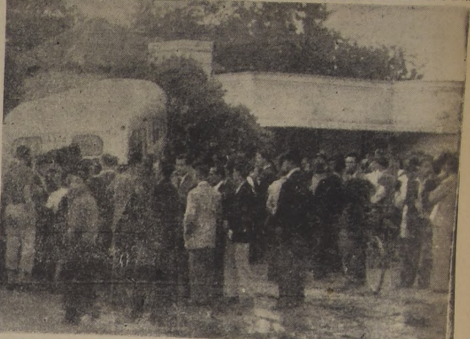
El micro N.º 112 de la Empresa Nacional de Transporte, con la violencia de la colisión, arrancó un árbol de raíz, lanzándolo sobre el muro de cemento de una casa particular, donde se detuvo el vehículo.

Tres heridos graves, un micro volcado y una casa particular, cuya fachada sufrió serios daños al caer sobre su verja un árbol que fué sacado de cuajo por la violencia del choque, fueron las consecuencias de la irresponsabilidad de dos choferes que imprimieron a sus respectivos vehículos una velocidad que sobrepasó los 40 kilómetros por hora.