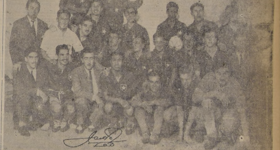
NUEVA CONQUISTA.— Integrantes del equipo chileno antes de entrar a la cancha a sostener su segundo compromiso por el Campeonato Sudamericano de Fútbol...

GUAYAQUIL, 12.—(U.P.)— Se puede decir que en el primer tiempo del partido entre Chile y Ecuador se jugó, en general, desordenadamente por ambas partes, sin verse buen fútbol. Dentro de una etapa mediocre, Chile actuó mejor, cargando a veces peligrosamente.