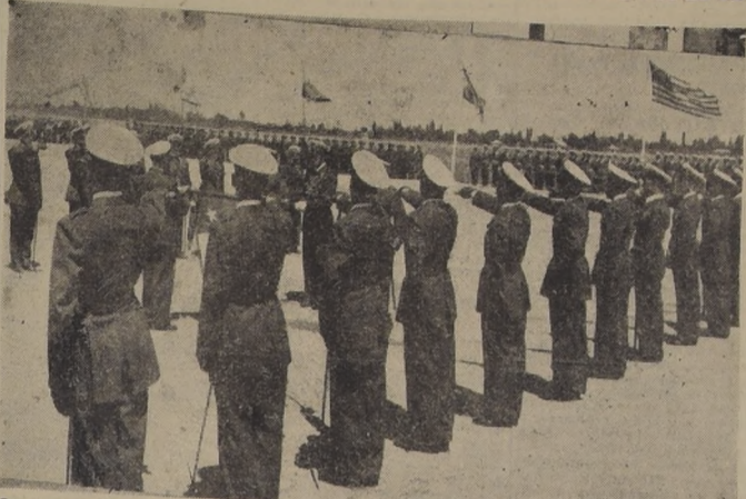
Los nuevos oficiales egresados de la Escuela de Aviación prestan juramento de fidelidad a la Bandera.

Terminado el discurso del Director del Establecimiento, los 25 nuevos oficiales, espada en mano, juraron ante el Pabellón Patrio consagrarse por entero al