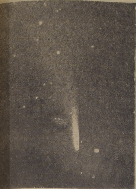
Así se vió ayer a las 21 horas, el cometa que cruza sobre el Hemisferio Sur. La fotografía fue captada a través de los telescopios del Observatorio Astronómico de la Universidad Católica.