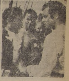
Fletcher Christian, piloto del buque de Su Majestad británica, "Bounty", le dice al guardiamarina Byam que no debe instigar una insurrección a bordo, en contra de la tiranía del Capitán Bligh. Más tarde Christian al mismo desempeña un importante papel en el sangriento motín que resultó ser uno de los más sensacionales episodios en la historia de los mares. Esta escena está tomada de "Molín a Bordo", un drama marítimo de la Metro Goldwyn Mayer, que se estrenará en el Teatro Metro.

Sin comentarios, camos a la publicidad la carta enviada por el secretario general del Centro Católico Cinematográfico de Roma, a la productora "Minerva Films", con referencia a la película "Roma, ciudad abierta", que Republic Pictures presenta ante nosotros desde el martes próximo como acontecimiento extraordinario con motivo de la inauguración del nuevo y moderno cine Plaza. La carta en referencia dice como sigue: "Desearnos expresarle nuestro vivo y particular agradecimiento por la cortés concesión de la copia de su película "Roma, ciudad abierta", que ha sido proyectada en exhibición especial a los miembros de la Secretaría de Estado de Su Santidad. Me es grato manifestarle que las altas autoridades asistentes a dicha exhibición han manifestado vivamente que se inspira su película "Roma, ciudad abierta", y la acertada calidad artística que la realización espectacular dignamente muestra. Desearnos igualmente atestiguarle la particular consideración con que el Centro Católico Cinematográfico aguarda la difusión de su película en el mundo entero".