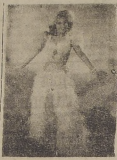
MARIA ANTONIETA PONS Jiménez, encabezando un elenco de primera categoría.