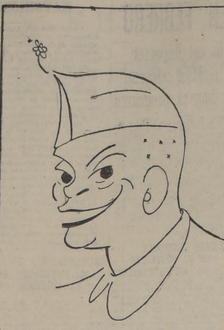
El general Eisenhower, a quien círculos políticos extraoficiales de Estados Unidos consideran con gran opción para la próxima Presidencia.