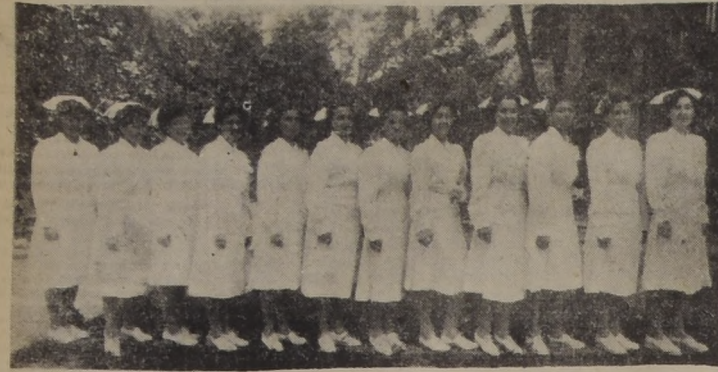
En presencia de altas autoridades médicas y educacionales, se realizó ayer el acto de graduación de las alumnas egresadas de la Escuela de Enfermeras de Beneficencia.