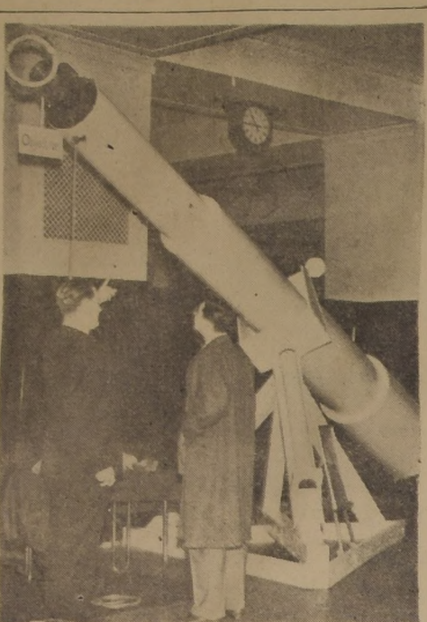
CHICAGO. Comprobando una teoría. Mediante el empleo de este telescopio, los científicos que observaron el eclipse total de sol en Brasil, pudieron recoger nuevas pruebas que confirman la teoría de Einstein sobre la relatividad.