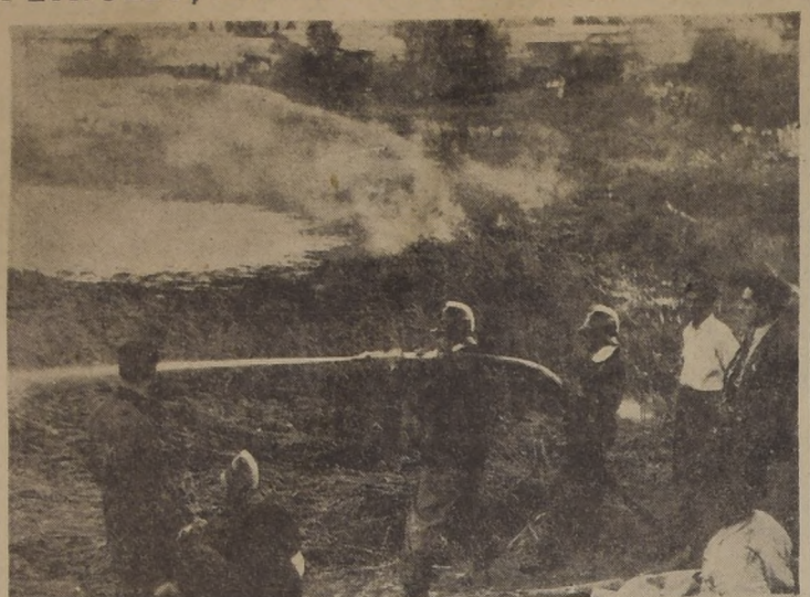
A las 18.15 horas estalló ayer un incendio en el botadero de residuos de petróleo de la Compañía Chilena de Lubricantes, ubicada en San Joaquín, levantando una gran columna de humo visible desde el centro de Santiago, y que hizo pensar en un siniestro de proporciones. El fuego consumió en ocho minutos todas las materias inflamables que