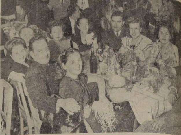
Aspecto de una de las últimas manifestaciones efectuadas en la terraza del Stade Français.