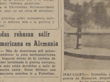
JERUSALEN.— Incendios en la Tierra Santa.— Un automóvil se incendia poco más allá de la puerta de Damasco, después que irguistas le lanzaron explosivos desde un coche en marcha. Más de 12 personas murieron a causa de la explosión y el incendio.