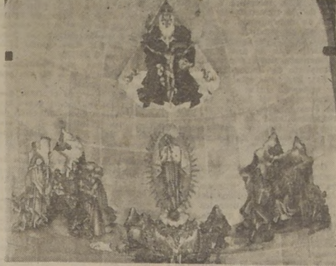
Cuatro hermosos frescos que se deben al pincel de don Alejandro Rubio Dalmate, adornan la nueva catedral. El misterio de la Trinidad; el Hombre Caído y la Redención; el Nacimiento y el Descendimiento. En el grabado, el Misterio de la Trinidad.

Intentaron robar en la oficina de Caja de Ahorros