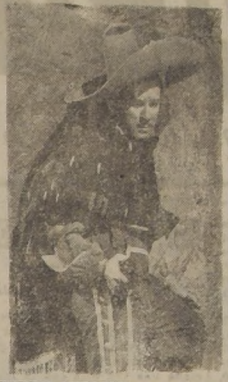
PEDRO INFANTE, a quien se le indicó como el sucesor de Jorge Negrete.