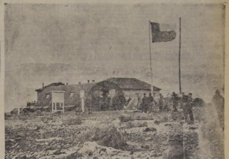
Estación meteorológica chilena en Puerto Soberanía (Isla Greenwich).