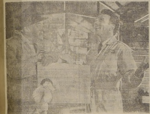
Sydney Greenstreet y Dane Clark en una escena de "El Pobre Ricachón".

¿Qué hará usted si fuera millonario y tuviera que retirarse de los negocios y encontrara su momento aburrida de la vida de soledad que su esposa quiere que usted haga? Sydney Greenstreet, ese admirable actor de Warner Bros. que ha triunfado rotundamente en Hollywood, después de haber sido muy famoso en el teatro en Europa y en Nueva York, se encuentra en este caso en que suponemos que quizás algún día usted pueda estar, cuando caracterice al personaje principal de la comedia "El pobre ricachón", que es una farsa en que Martha Vickers es su hija, Craig Stevens el prometido de ésta y Dane Clark el joven sin fortuna que