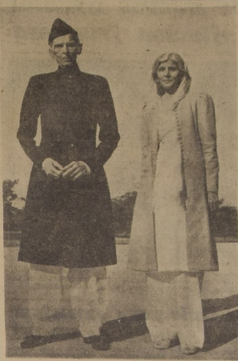
KARACHI.—Pakistán.— De cumpleaños.— Mohammed Ail Jinnah, Gobernador General del Pakistán, celebra su 72.º cumpleaños, dando un paseo por los jardines de su residencia en esta ciudad, en compañía de su hermana Fatima.