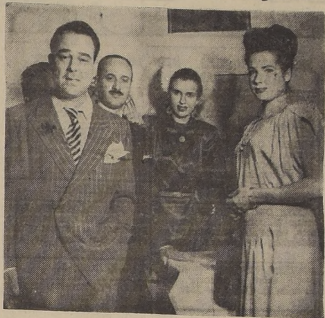
EN LA FOTOGRAFIA VEMOS UN ASPECTO DEL COCKTAIL QUE AYER LE OFRECIO LA DIRECCION DE "LA QUINTRALA" AL POPULAR CANTANTE ARGENTINO