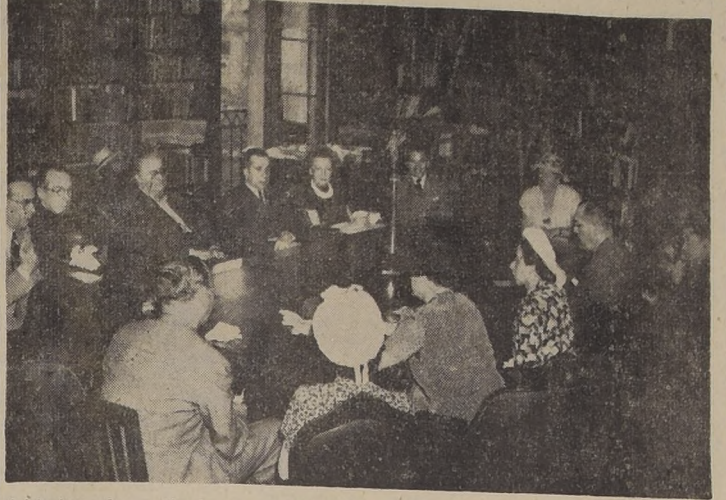
Asistentes a la reunión de ayer en que quedó constituido el Comité Chileno pro Niños Desvalidos de Europa.