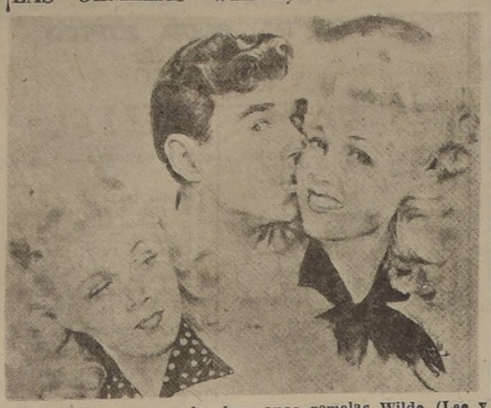
Marshall Thompson y las hermanas gemelas Wilde (Lee y Lyn), quienes tienen roles de importancia al lado de Preston Foster y Gail Patrick en "Doble Ilusion", festiva comedia de la Metro Goldwyn Mayer, totalmente hablada en castellano, que se estrenará el jueves en el Teatro Metro.