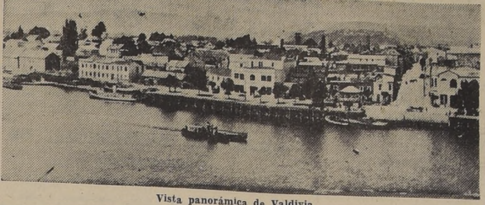
Vista panorámica de Valdivia