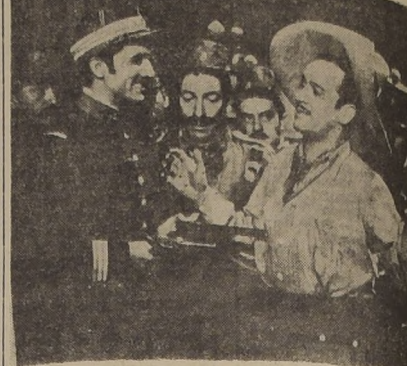
VICTOR MANUEL MENDOZA Y PEDRO INFANTE EN ESCENA DE "CUANDO LLORAN LOS VALIENTES"