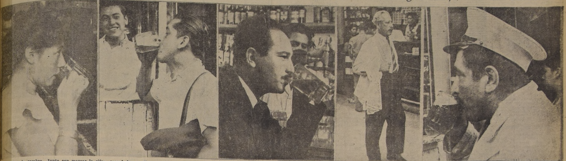
33,7° a la sombra. Junto con marcar la cifra record de temperatura de este verano, ayer fue uno de los más calurosos de los últimos años. A las 16.15 horas, el calor llegó a su punto culminante mientras la población sedentaria de San-

El verano marcó ayer su temperatura record del año en Santiago: 33,7° a la sombra