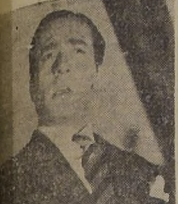
Roberto Quiroga en una escena de "El cantor del pueblo".