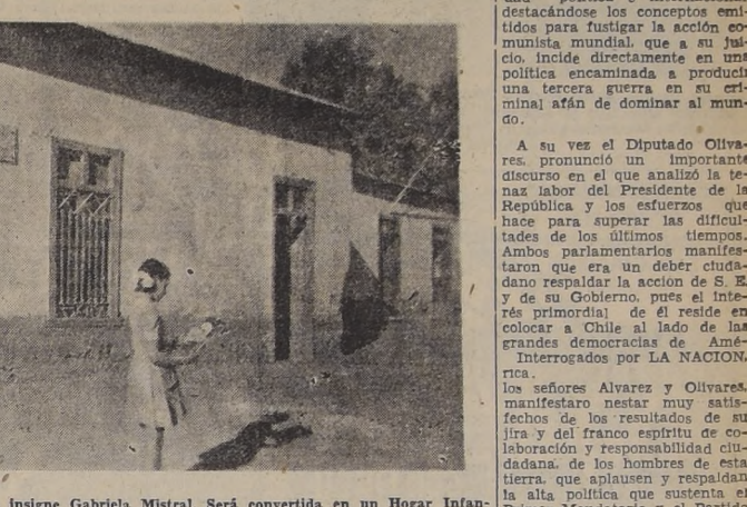
En esta casa nació en Vicuña la insigne Gabriela Mistral. Será convertida en un Hogar Infantil, gracias a los aportes de sus propios conterráneos y a la efectiva ayuda prestada por el Supremo Gobierno.