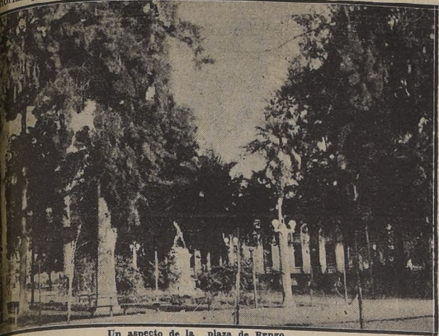
Un aspecto de la plaza de Renko.