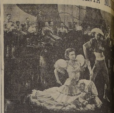
El grabado nos muestra un hermoso cuadro de la "Sinfonía del Amor", que estrenará el Rex. Al fondo puede verse el famoso pianista Carmen Cavallaro.