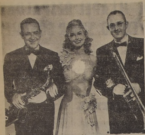
Jimmy Dorsey, Janet Blair y Tommy Dorsey, figuras principales de "Que Siga la Armonía", nueva película de la editora Artistas Unidos, y que muy pronto se conocerá en nuestra capital