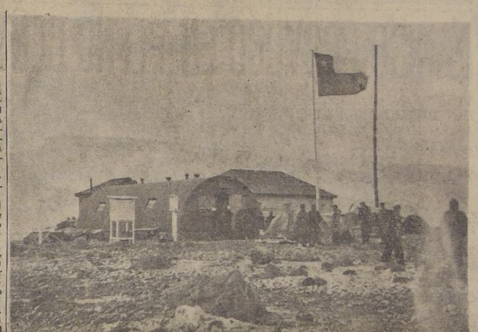
La Base Naval de Chile en la Antártida

Vuelvo a insistir en que la Cancillería de mi país será la que opine sobre la cuestión de fondo. Este comentario es un (PASA A LA PAG. 2).