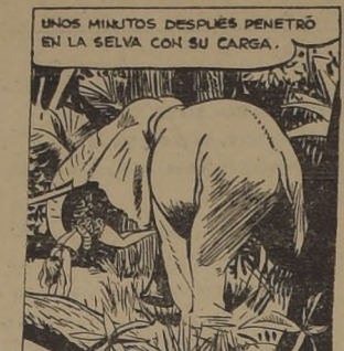
UNOS MINUTOS DESPUÉS PENETRÓ EN LA SELVA CON SU CARGA.