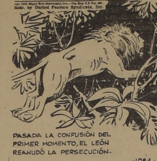
PASADA LA CONFUSION DEL PRIMER MOMENTO, EL LEÓN REANUDÓ LA PERSECUCION.