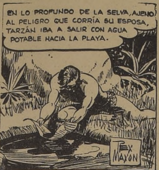
EN LO PROFUNDO DE LA SELVA, AUNO AL PELIGRO QUE CORRÍA SU ESPOSA, TARZAN IBA A SALIR CON AGUA POTABLE HACIA LA PLAYA.