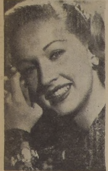
La hermosa Bonita Granville, estrella de "Desayuno en Hollywood". Sin dudas, Bonita hace honor a su nombre...