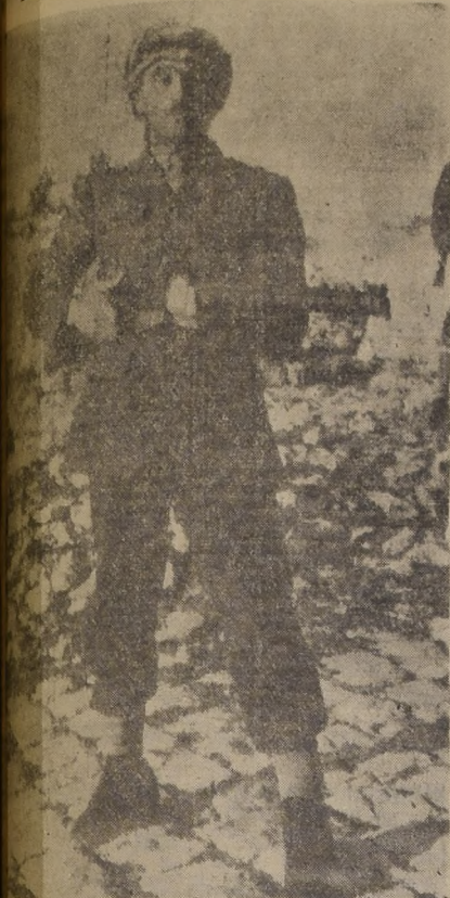
UN LUGAR DE LA PALESTINA.— Usando un uniforme cualquiera, con corbata, un sargento árabe se mantiene con rifle en mano, en los cerros situados en el norte de Palestina, esperando órdenes para atacar posiciones judías a través de la frontera para impedir la división de la Tierra Santa.