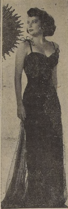
Ava Gardner una de las jumanas de los Estados Unidos. Goldwyn-Mayer luce en esta foto un regio traje de noche de chiffon con "sequitas" lumbagos...