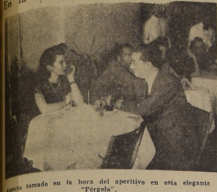
Aspecto tomado en la hora del aperitivo en esta elegante "Pérgola".