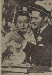
Silvana Roth y Francisco de Paula, dos estrellas del cine argentino que aparecen en el grabado...