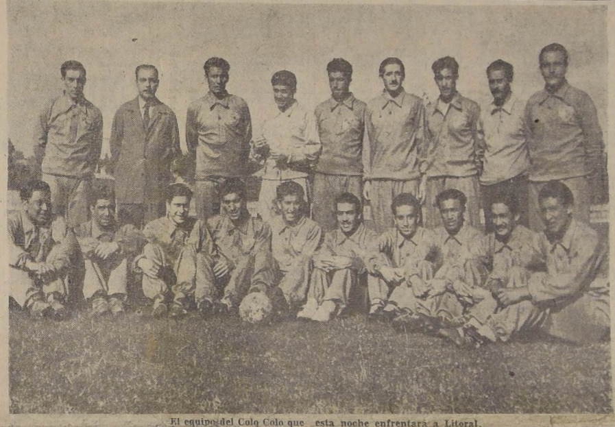
El equipo del Colo Colo que esta noche enfrentará a Litoral.