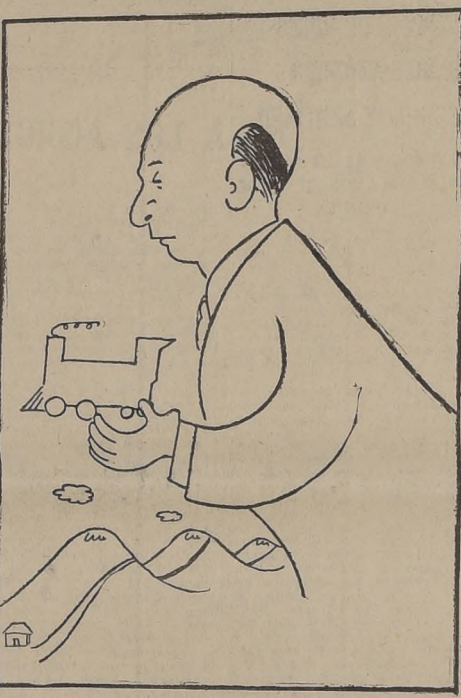
Don Ernesto Merino Segura, Ministro de Obras Públicas, quien acaba de señalar la trascendental importancia del nuevo ferrocarril de Antofagasta a Salta.