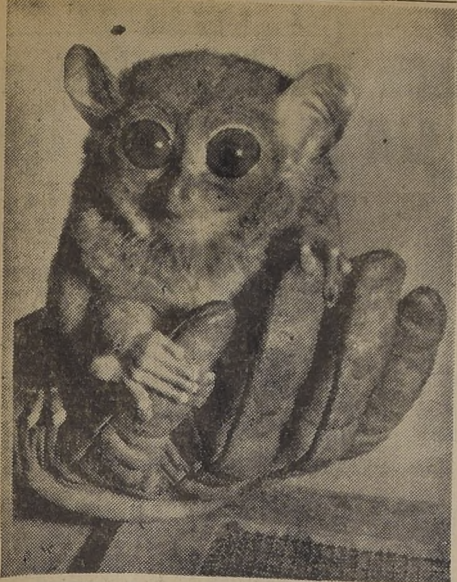
LONDRES. — Este pequeño mamífero, que cabe en la palma de una mano, puede ser el definitivo eslabón que se busca en la cadena de la evolución del hombre. Algunas autoridades sostienen que su cerebro se parece al del mono, más que al de cualquier otro lémur. Esta creatura es uno de los tres tarsiers adictados por el Zoológico de Londres, en Filipinas, donde se alimenta de insectos en la noche y se esconde de día. (Foto: ACME).