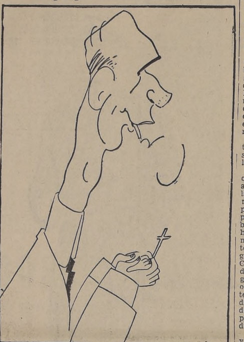
Lord Halifax, el conocido ex Ministro de Relaciones Exteriores de Gran Bretaña, quien en una reunión del Movimiento de Acción Cristiana acaba de lanzar un desafío al comunismo.