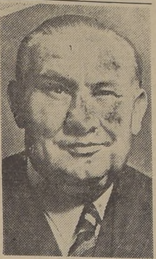
Mr. Bevin, quien ha declarado que Londres accederá a prolongar por breve lapso su administración inglesa en Palestina, si esta medida es solicitada por árabes y judíos

Fuerzas unidas del Irún y del Haganá, están penetrando al puerto árabe INGLESES LANZAN CARROS DE ASALTO