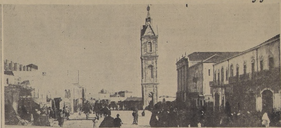
Vista del puerto árabe de Jaffa, que está siendo dominado por los judíos, a pesar de los esfuerzos de las mermadas tropas de Gran Bretaña.

Las fuerzas árabes que defienden Jaffa están constituidas por algunas unidades de la Legión Árabe del rey de Transjordania, reforzadas por algunos combatientes mal pertrechados. Los irgunistas dominan el extremo suroccidental desde allí, con el propósito aparte de eliminar las posiciones árabes en la zona neutral entre Jaffa y la ciudad judía.