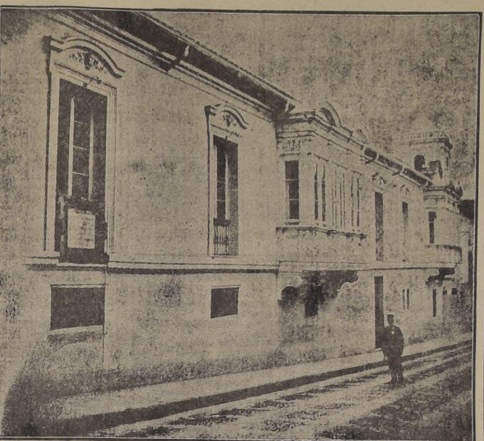
La casa de Bolívar en Bogotá