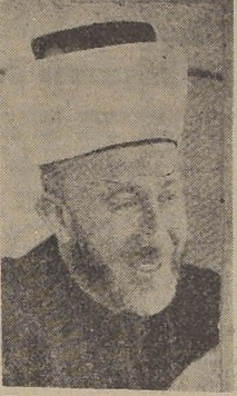
El Gran Mufti, de Jerusalén, personaje de actuación decisiva dentro de la Liga Arabe