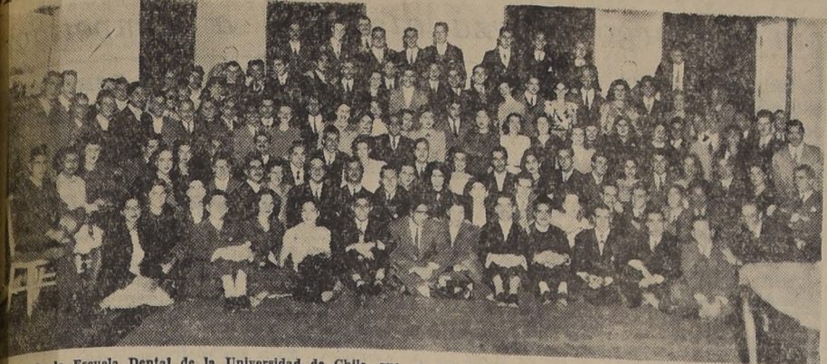
Estudiantes de la Escuela Dental de la Universidad de Chile, que se reunieron en una recepción que tuvo lugar en el Hotel Carrera.