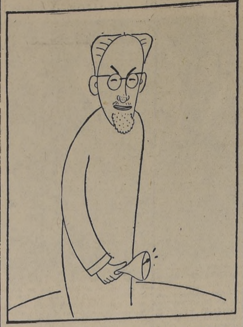
Ivanoe Bonomi, que ha sido elegido Presidente del Parlamento italiano.