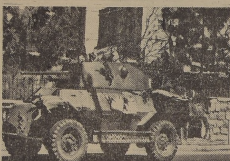
JERUSALEN.— Un carro blindado de la Legión Árabe pasa por la "tierra de nadie", que en este caso es el cementerio que está entre los barrios árabe y judío en Jerusalén y a través del cual cruzan constantemente las balas de ambos bandos.

Rusia encabezó la protesta contra el gobierno simbólico de Palestina