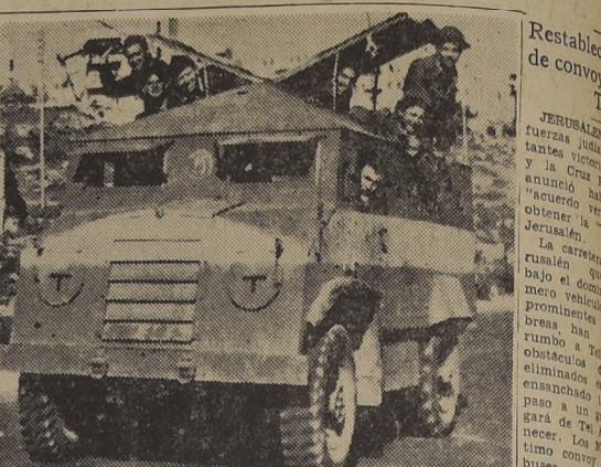
JERUSALEN.— Sorrientes y felices, estos soldados judíos del ejército del Haganah, levantan las tapas de este carro blindado al llegar a Jerusalén, después de acompañar un convoy desde Tel Aviv.

WASHINGTON, 10. (U. P.).—Por la mayoría de las gentes la bomba atómica es sinónimo de muerte segura, rápida y horrible. Sin embargo, para Jati, nativo de la isla de Bikini, ella tiene el significado de liberación de la sombra eterna. El caso suyo fue accidental, pero sus experimentos atómicos hechos en su isla, Bikini, le habría abierto los ojos a la vida. La Marina norteamericana ha referido el milagro. Cuando las fuerzas de Estados Unidos llevaron a los nativos a una isla distante, los sometieron a examen médico y descubrieron que Jati tenía cataratas. Lo llevaron en avión al hospital naval de la isla de Guam, y allí fue operado con gran éxito. Ahora Jati duerme lo menos posible. Dice que quiere mirar todo lo que no pudo ver durante sus años de ceguera absoluta.