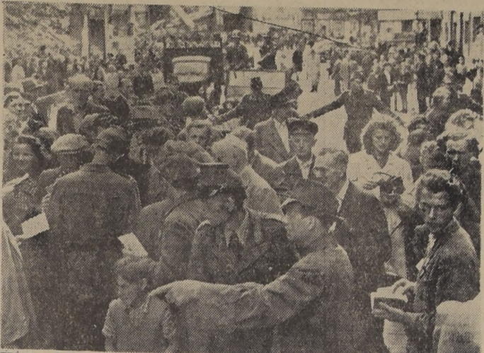
BERLÍN.— Bajo la dirección del Ejército de los Estados Unidos (al fondo en un jeep), la policía alemana dispersa a los que realizan operaciones con monedas en el mercado negro en el sector norteamericano. E los comerciantes del mercado negro monetario entraron en acción el 25 de junio, alemán que reemplazó al antiguo Reichmark. El tipo oficial de cambio es de un marco nuevo por diez de los viejos; pero el precio en el mercado negro varía en cada zona. Los rusos también tienen un marco alemán para su sector y dicen que es la única moneda aceptable para todo Berlín.— (Foto ACME).