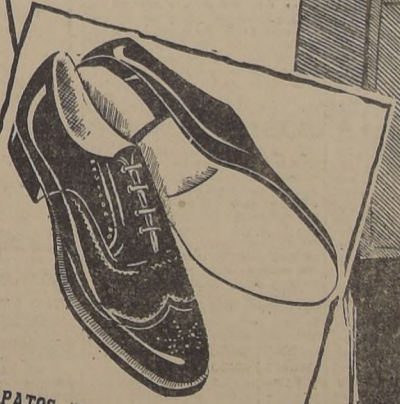
ZAPATOS "GOOD YEAR", oferta especial. Desde... $ 198.-

PILOTOS PILOTOS dobles, con entretela vulcanizada... $ 1.460.- IMPERMEABLES, tipo "PILOTO", forro escocés, con entretela vulcanizada... $ 1.575.-