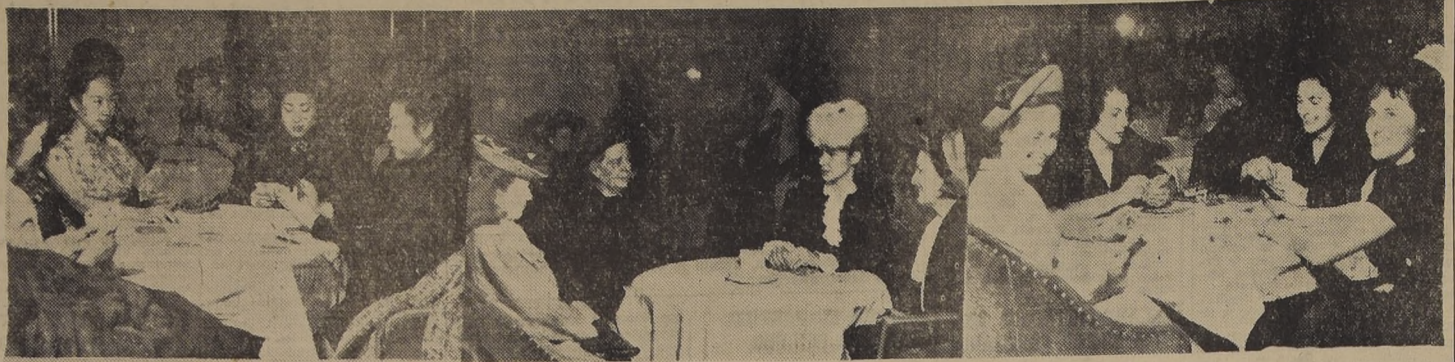
Aspectos tomados durante el té a beneficio de Obras Sociales, organizado por la Sociedad de ex alumnas del Santiago College.