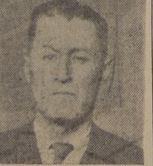
Muy señor nuestro: Cumpléndose el 2.º aniversario del fallecimiento de nuestro querido e inolvidable esposo y padre, señor