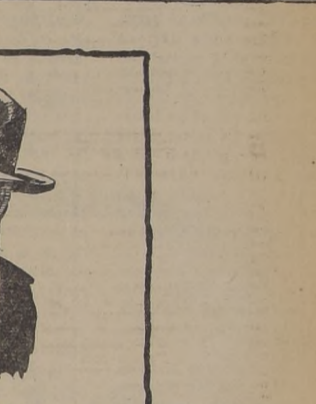
SOMBREROS de fieltro, gran variedad de coloridos y modelos. Desde... $ 170.-