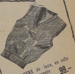
SWEATERS de lana, en colores de gran aceptación. Desde... $ 99.-