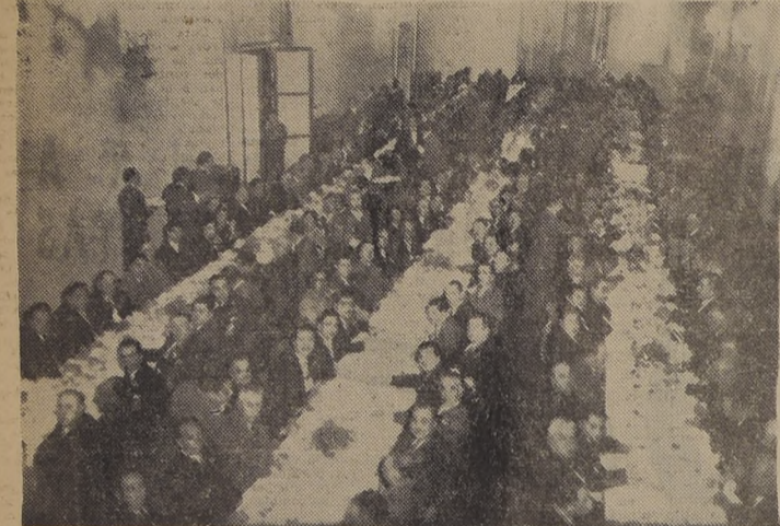
Aspecto tomado durante el banquete que tuvo lugar en el Hotel Carrera la noche del martes, con que el Partido Radical-Democrático, clausuró la convención, realizada recientemente en esta capital.

A LOS EX ALUMNOS DE LA UNITED STATES ACADEMY. — Circula la siguiente invitación: “La Dirección de la United States Academy, se complace en invitar a usted y familiares al acto que, con motivo del 172.º Aniversario de la Independencia de los Estados Unidos de Norte América, se llevará a efecto el sábado próximo, a las 14.30 horas, en el local del establecimiento, Avda. Irarrázaval 2067, Ñuñoa. Santiago, julio de 1948”.