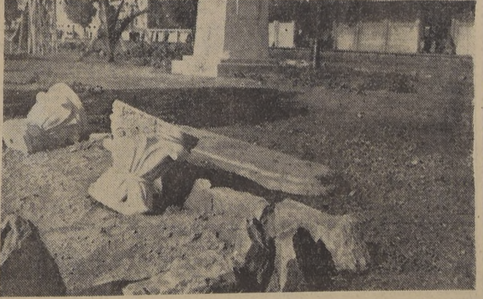
En el Paseo Agustín Edwards, la violencia de las olas destruyó los jardines, arrancando, incluso, los escaños de piedra. Hubo expectación en el público. Durante la noche, el mal tiempo y los vientos huracanados predominaron en el puerto.