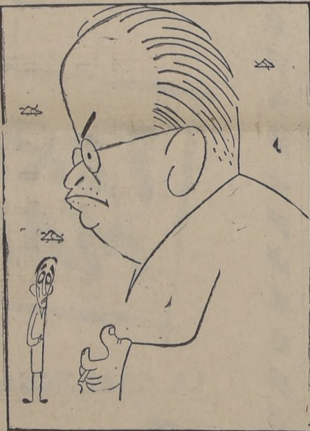
El comunista italiano Palmiro Togliatti, que ha vuelto a atacar el Plan Marshall y la ayuda norteamericana a Italia.