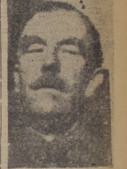
El General Sir Brian Robertson, quien se encuentra en Londres conferenciando con el Gobierno acerca de la grave situación creada en Berlin.

BERLIN, 12. (U. P.)— Un oficial de enlace soviético anunció esta tarde que se ha suspendido todo tránsito desde Berlin hacia la zona soviética, y que todos los permisos expedidos previamente han quedado sin valor. Hasta ahora se requería que todos los automóviles y camio-