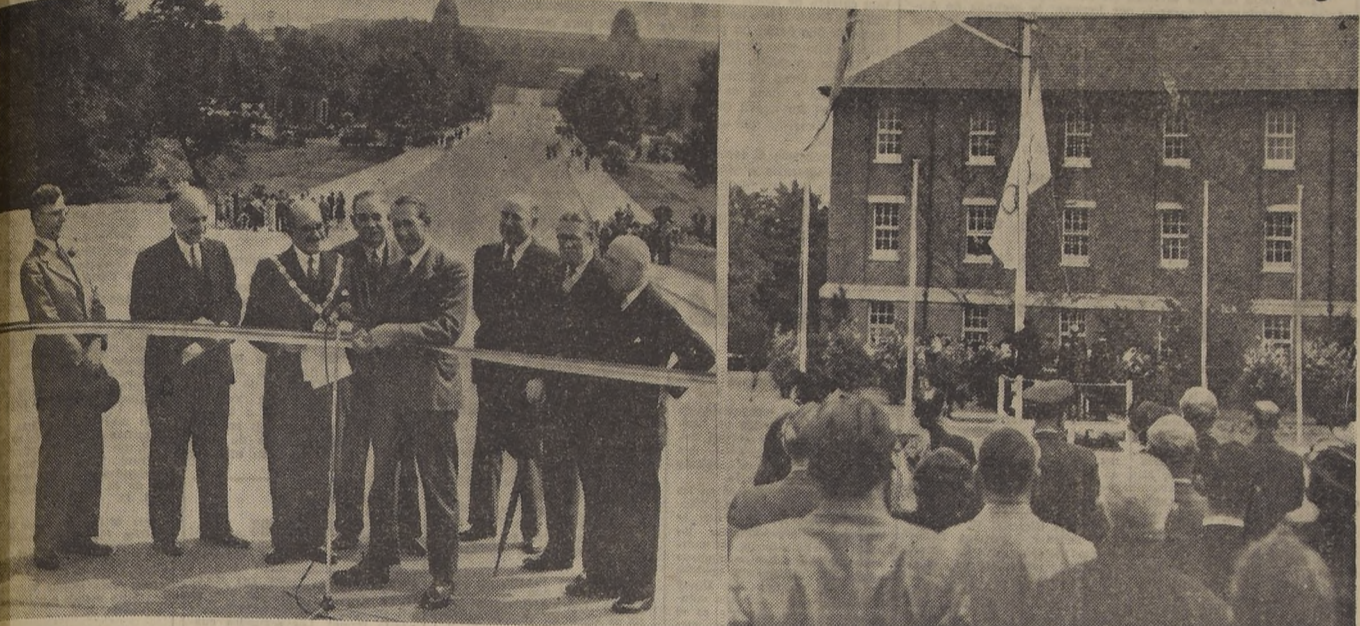
LONDRES.— Una nueva carretera que conduce al Estadio de Wembley fué inaugurada recientemente por el Ministro de Transporte de Inglaterra, señor Alfredo Barnes, a quien se ve a la izquierda, en el momento de cortar la huincha en un acto simbólico. El Alcalde de Wembley, H. S. Sirkett, que lleva