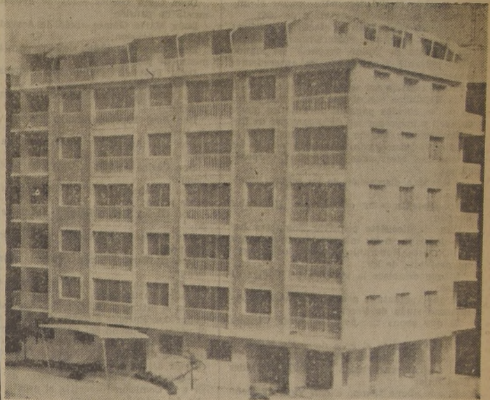
Un aspecto del nuevo y moderno edificio de locales comerciales y Departamentos, cuya construcción cambia totalmente el aspecto de la calle Mapocho entre Estado y San Antonio