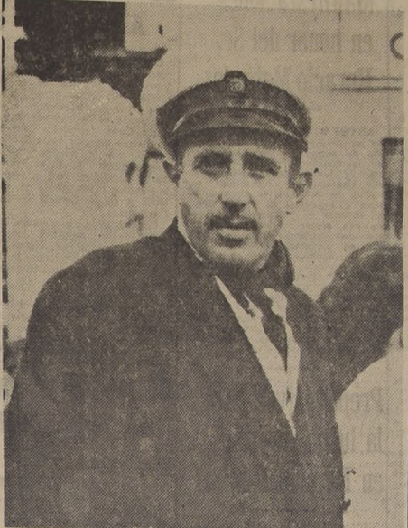
TORQUAY, Inglaterra.— El Infante don Jaime, pretendiente al trono de España, se dedica a observar las carreras de Yates en la Olimpiada Mundial en Torquay, Inglaterra, el lunes 2 de agosto.