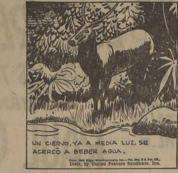
UN CIERVO, YA A MEDIA LUZ, SE ACERCÓ A BEBER AGUA.