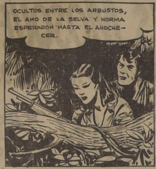
OCULTOS ENTRE LOS ARBUSTOS, EL AMO DE LA SELVA Y NORMA ESPERARON HASTA EL ANOCHER.