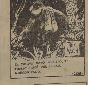
EL CIERVO CAYO MUERTO, Y TROTAL HUYO DEL LUGAR HORRORIZADO.