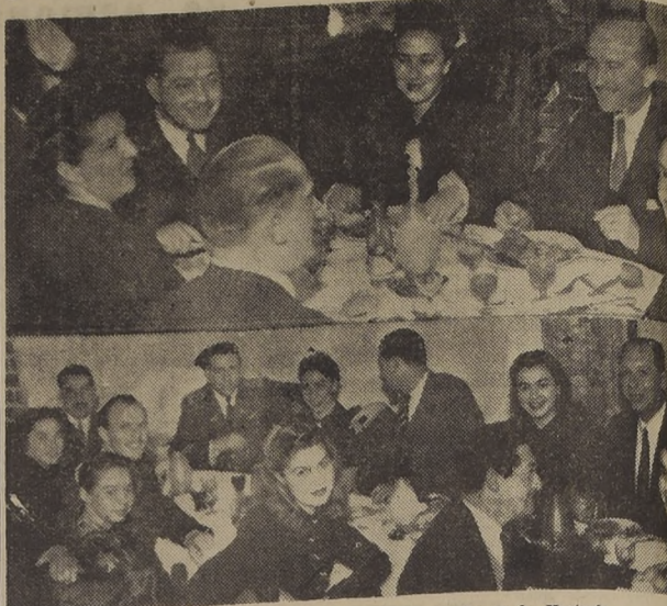
Aspecto tomado en la hora de comida en la Hosteria.