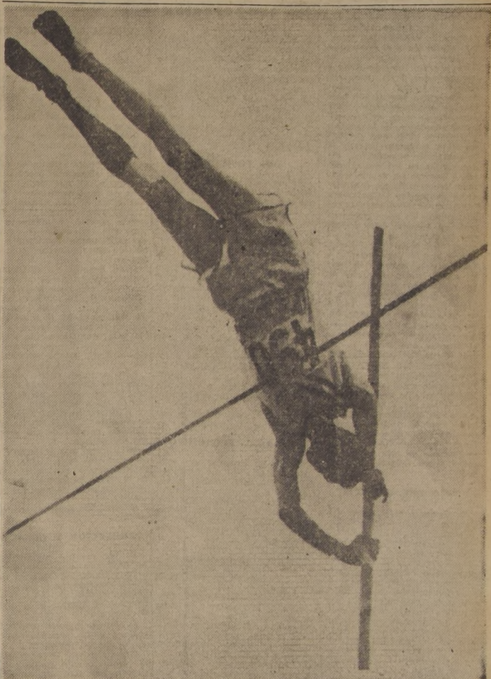
EL MEJOR GARROCHISTA. — El grabado capta el instante preciso en que Owen Guinn Smith, de Estados Unidos, cruza la varilla en las finales del salto con garrocha, dando a su país un nuevo triunfo olímpico.

ARGENTINOS. — Conjunto de básquetbol de Argentina, que ayer fué superado sorpresivamente por Checoslovaquia, por 45 puntos contra 41. Los transandinos perdieron ahí su opción a intervenir en la final.