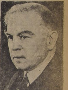
El Premier Mackenzie King

SOLO ESPERA ELECCION DE NUEVO JEFE LIBERAL PARA ABANDONAR EL MINISTERIO