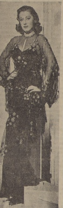
ELANOR PARKER, estrella de los estudios Warner Bros, que aparecerá en la versión cinematográfica de dicha editora ha realizado de la obra teatral "La voz de la tortola", que próximamente exhibirá el cine Rex.