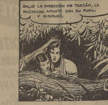
BAJO LA DIRECCION DE TARZAN, LA MUCHACHA APUNTO CON SU FUSIL Y DISPARO.