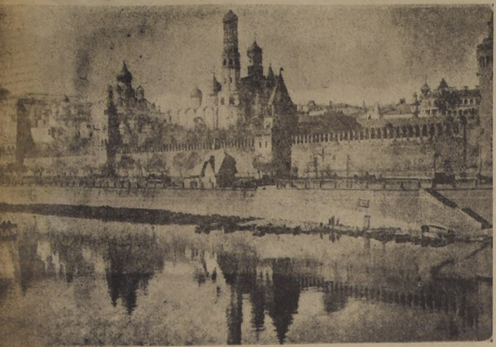
Vista exterior de la ciudadela del Kremlin, en cuyo recinto se encuentra el edificio del Comisario de Relaciones de los Soviets, donde se celebran las conversaciones entre los representantes occidentales y Molotov.

Los berlineses volvieron a apedrear a la policía del sector soviético