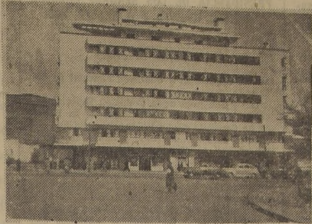
Un aspecto del edificio, mirado desde el frente

siete pisos, está distribuido de la siguiente manera: primer piso, locales comerciales; segundo al séptimo, Departamentos. Estos departamentos constan de uno y dos dormitorios, con living, comedor, baño, cocina, etc. Espléndido servicio de ascensores, refrigeración, agua, luz, gas y aseo, favorecen a la totalidad de los departamentos.