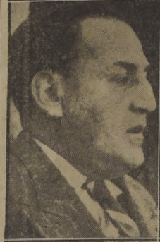
VICTOR RAUL HAYA DE LA TORRE.

"En consecuencia, la delegación soviética declara que no participará en la consideración de la cuestión de Berlín en el Consejo de Seguridad".