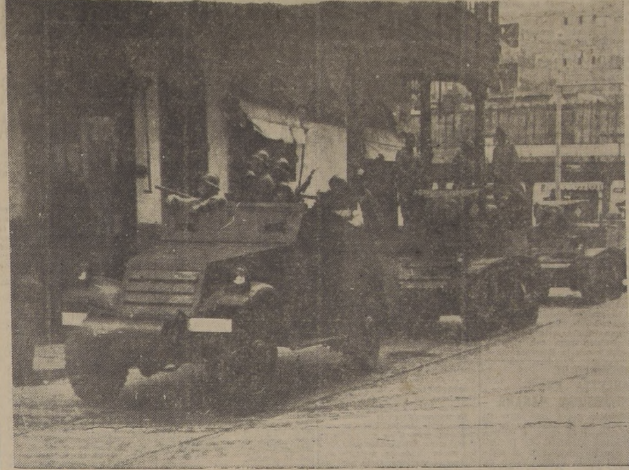
EL CALLAO.— Tanques y carros blindados se dirigen a dominar a los marineros y apristas sublevados.— (Foto ACME).

oro y a los representantes de las Asociaciones Mineras, a fin de ver si era posible llegar a un acuerdo con el Gobierno sobre las observaciones que el Ejecutivo formulará a la ley antes mencionada. Ofreció la palabra al Ministro de Economía con el objeto de que expusiera los puntos de vista del Gobierno.