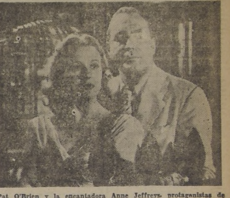
Pat O'Brien y la encantadora Anne Jeffreys, protagonistas de "Conflicto en Panamá", nueva obra cinesca de RKO Radio, que se estrenará el viernes en el Rotativo "Roxy".