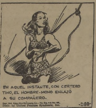
EN AQUEL INSTANTE, CON CERTEZO TINO, EL HOMBRE-MONO ENLAZO A SU COMPAÑERO.