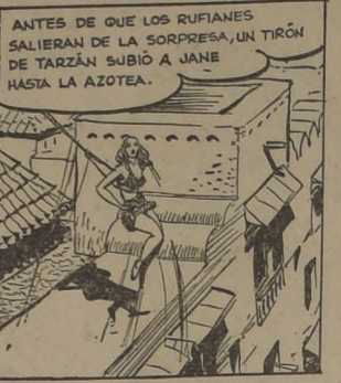
ANTES DE QUE LOS RUFIANES SALIERAN DE LA SORPRESA, UN TIRÓN DE TARZAN SUBIÓ A JANE HASTA LA AZOTEA.