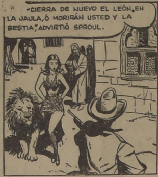
CIERRA DE NUEVO EL LEÓN, EN LA JAULA, O MORIRÁN USTED Y LA BESTIA, ADVIRTIÓ SPROUL.