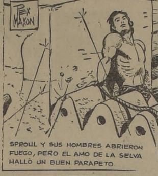
SPROUL Y SUS HOMBRES ABRIERON FUEGO, PERO EL AMO DE LA SELVA HALLÓ UN BUEN PARAPETO.