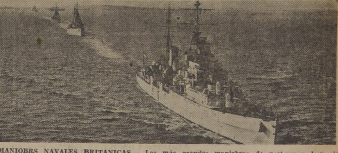
MANIOBRAS NAVALES BRITANICAS.— Las más grandes maniobras de postguerra han sido realizadas últimamente por la Flota Metropolitana Británica. Los cruceros de la Flota atraviesan el Canal de la Mancha.

Secretario de D. Juan se dirigió a Madrid