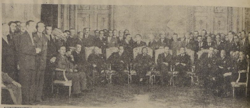
ASISTENTES al banquete ofrecido en la noche del jueves, en el Club de la Unión, por los prestigiosos agricultores de los premios Champion...