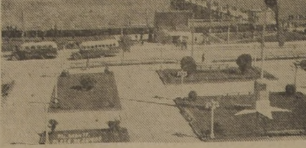
Aspecto de la Plaza y Muelle de Puerto Montt, centros de simpatía colorido de la ciudad capital de Llanquihue, que se apresta a celebrar su primer siglo de vida con un plan extraordinario de obras públicas, financiado en gran parte con sus propios aportes.