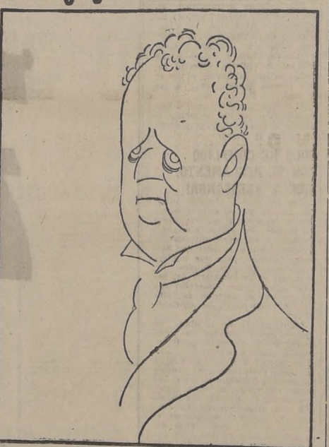
El eminente trágico Ernesto Zacconi, que acaba de fallecer en Italia.