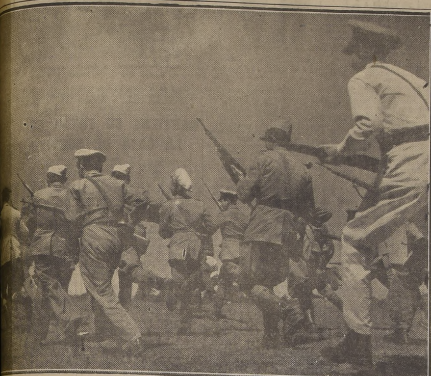
Revolucionarios paraguayos en plena acción.