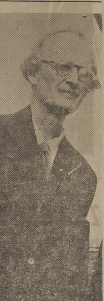
Profesor Auguste Piccard que ayer descendió a 1.400 metros de profundidad en el mar, y que proyecta hacerlo hasta seis mil metros.