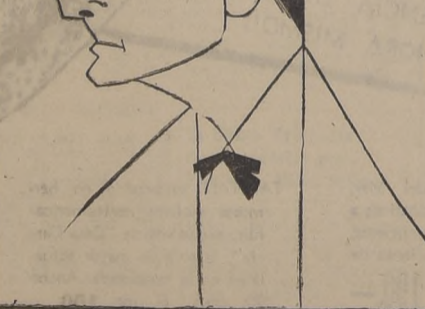
El poeta inglés T. S. Eliot, que ha obtenido el Premio Nobel de Literatura de 1948.