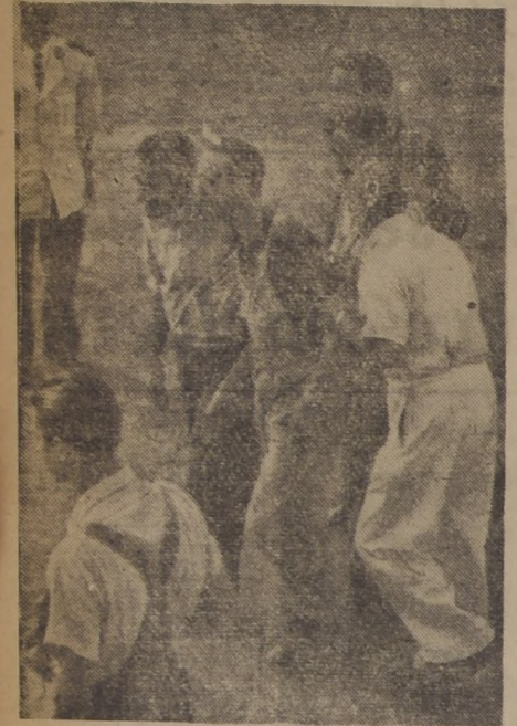
DE TRIUNFO EN TRIUNFO. - Ya nadie duda de que Oscar Gálvez será el ganador del Gran Premio de la América del Sur. La ventaja que lleva es cada vez más amplia. En el grabado, lo vemos dirigiéndose al control luego de haber cruzado la meta vencedor en una de las seis etapas que se ha adjudicado hasta el momento.