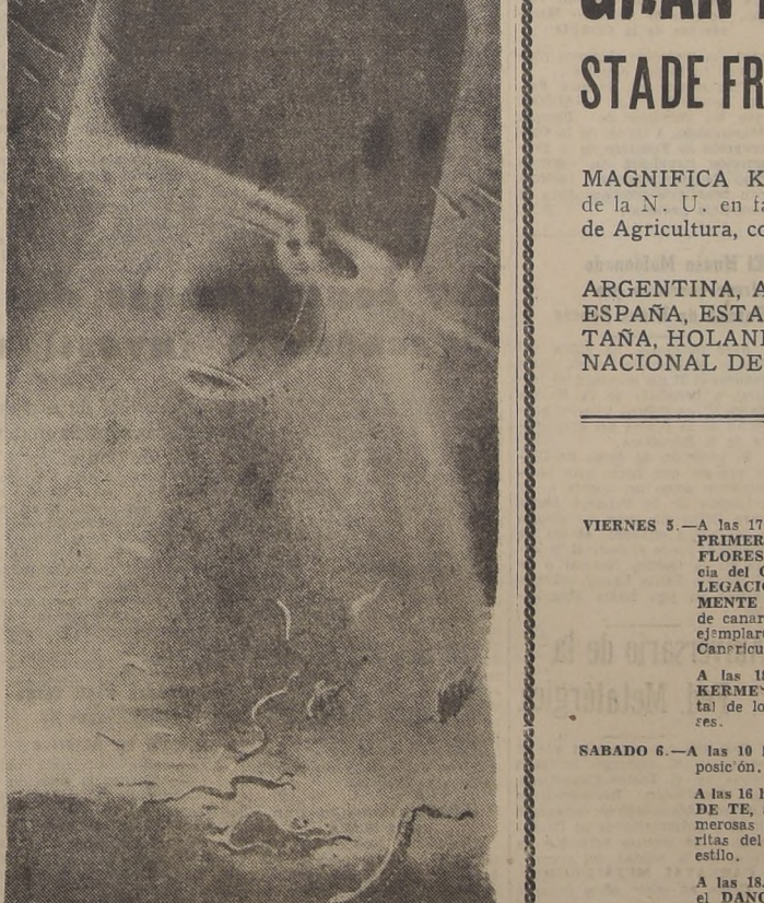
El "Hydrostat", en que el doctor Auguste Piccard efectuó su descenso de 1.400 metros, está diseñado a semejanza de los globos, y tiene dos hélices que le permiten moverse horizontalmente. Con gigantescos reflectores de tres mil quinientas bujías ilumina el fondo del mar.