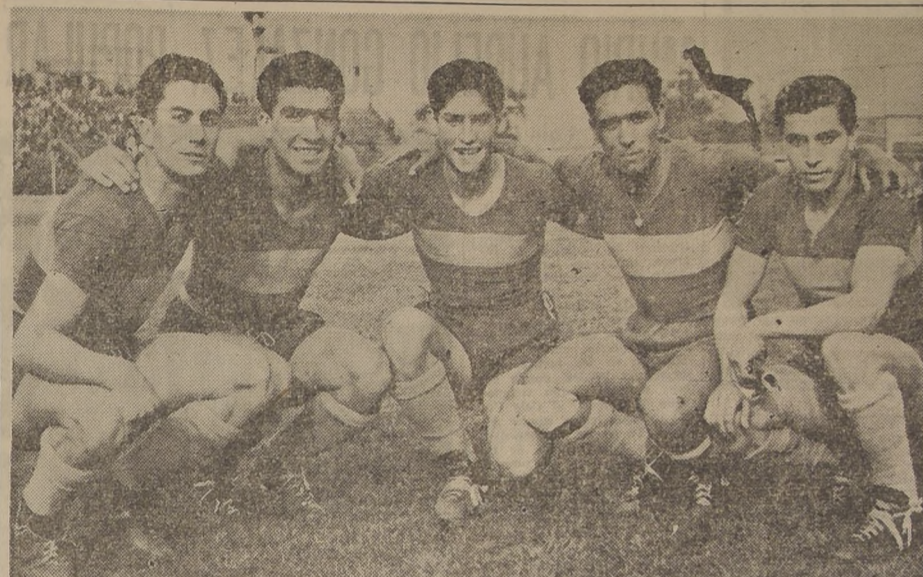
DESTREZA Y PELIGROSIDAD — Esas son las características del juvenil ataque del Everton...