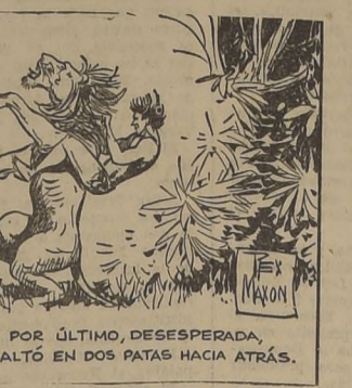
Y POR ÚLTIMO, DESESPERADA, SALTÓ EN DOS PATAS HACIA ATRÁS.