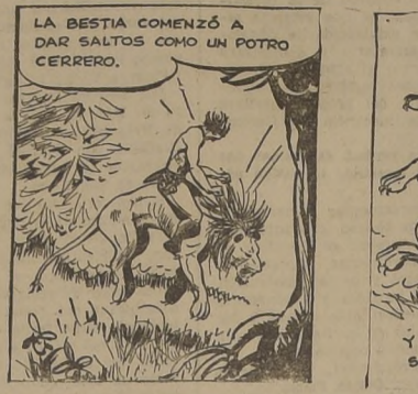
LA BESTIA COMENZÓ A DAR SALTOS COMO UN POTRO CERRERO.