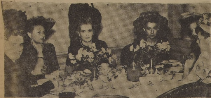
Aspecto tomado durante el té-bridge-canasta a beneficio de las Obras Sociales de la Reina...