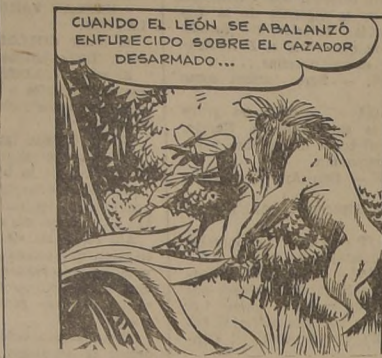
CUANDO EL LEÓN SE ABALANZÓ ENFURECIDO SOBRE EL CAZADOR DESARMADO...