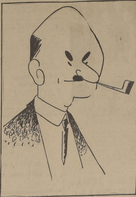
Clement Attlee, Primer Ministro de Gran Bretaña, quien se ha opuesto a que el diferendo ruso-occidental sea tratado fuera de la NU.