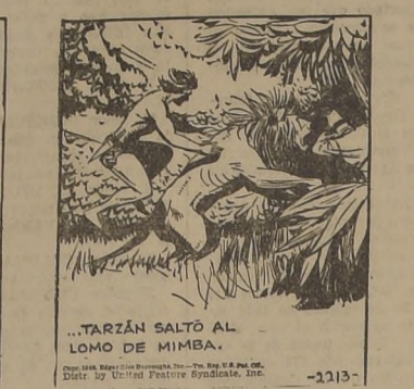
TARZAN SALTÓ AL LOMO DE MIMBA.