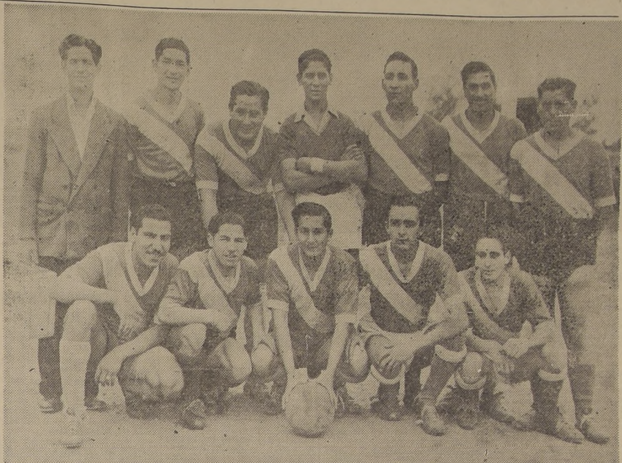
CLUB DEPORTIVO TOLTEN.— Equipo superior de esta entidad que ha conseguido una destacada figuración en el campeonato provincial de fútbol de los barrios...

17.30 HORAS: Boston con Juventud Oriente, cuadros superiores; árbitro, del Mecánico.