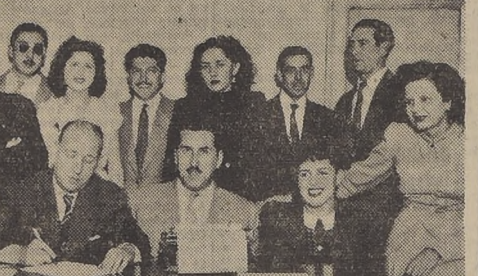
El Club Atlético Empleados de Gath & Chaves eligió candidatas a Reina para su próxima fiesta anual, cuyo primer escrutinio se llevará a efecto en los salones del Club Deportivo Nacional (Central) el sábado 20 del presente con un gran baile de fantasía. En la foto, el Directorio y las candidatas con sus apoderados en el momento de firmar el acta de inscripción.