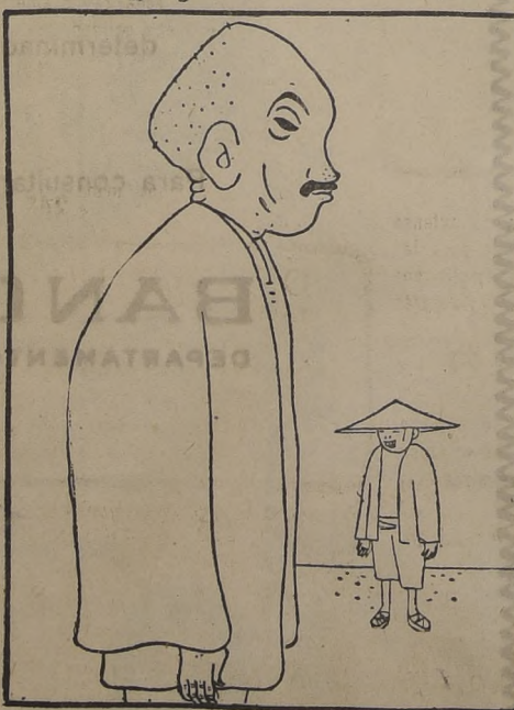
El Generalísimo Chiang Kai Shek, cuya situación se torna difícil con el avance de las tropas comunistas.