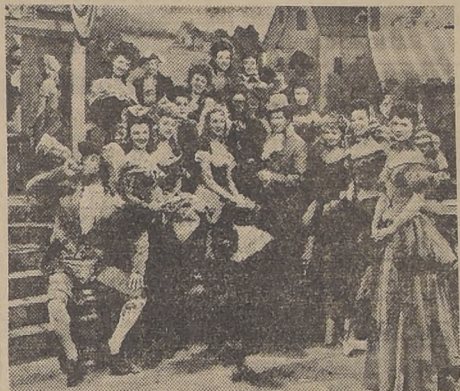
Esta es una escena de la comedia que estrenará el Rex el próximo jueves.

ALEGRE Y CHISPEANTE ES EL FILM "MI ROSA SILVESTRE": EN EL REX