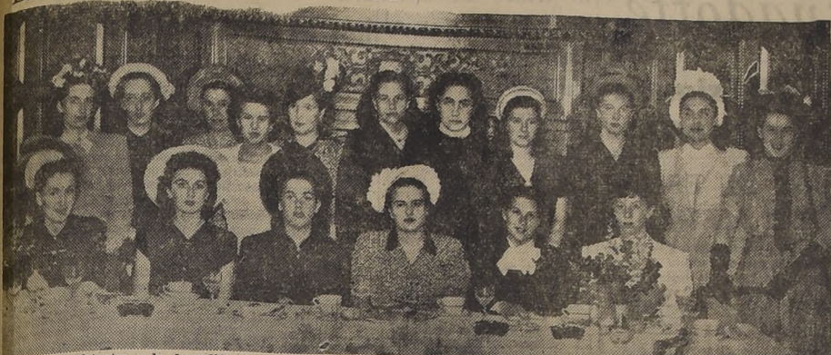
Vista tomada durante el almuerzo de ayer en el Club de la Unión, ofrecido en honor del General Edgar E. Hume.