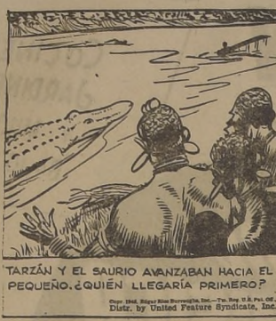
TARZAN Y EL SAURO AVANZABAN HACIA EL PEQUEÑO. ¿QUIÉN LLEGARÍA PRIMERO?