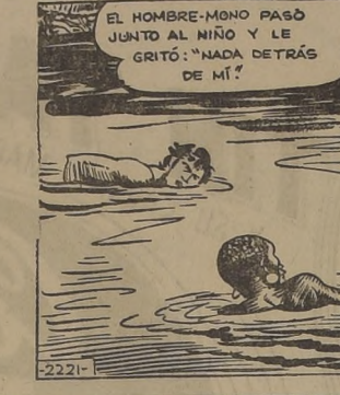
EL HOMBRE-MONO PASÓ JUNTO AL NIÑO Y LE GRITÓ: "¡NADA DETRÁS DE MÍ!"