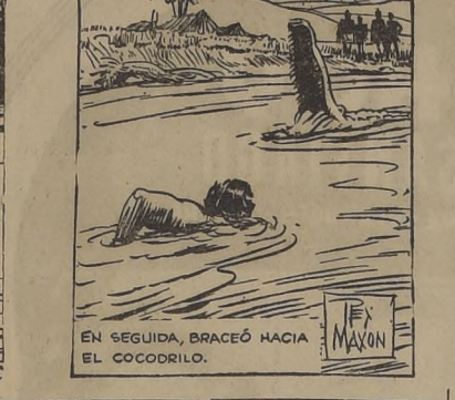
EN SEGUIDA, BRACEÓ HACIA EL COCODRILLO.