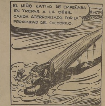
EL NIÑO NATIVO SE EMPEÑABA EN TREPAN A LA DÉBIL CANOA ATERORIZADO POR LA PROXIMIDAD DEL COCODRILLO.