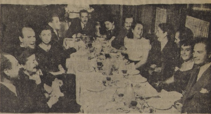
Aspecto tomado en la hora de comida en la Hosteria.

La sociedad de Santiago esta excepcional fiesta de la caridad, de la alegría y del arte. guardará gratos recuerdos de vedosas atracciones.