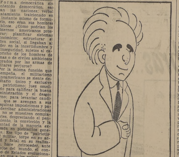
David Ben Gurion, que ha pedido el ingreso de Israel en la Organización de las Naciones Unidas.