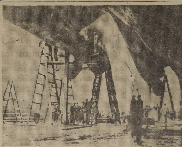
LA CUNA DE LAS REINAS DE LOS MARES SOUTHAMPTON, Inglaterra. — La dársena "Rey Jorge V", que está en servicio desde 1933, es la más grande de su tipo en el mundo. Este gigantesco dique seco puede albergar buques hasta de cien mil toneladas. Aquí se ve a unos operarios inspeccionando las gigantescas hélices del transatlántico "Queen Mary" (Reina María) de 51.000 toneladas de desplazamiento, durante la revisión anual a que es sometido. Se emplearon cuatro horas en achicar cincuenta y ocho millones de galones de agua antes de que se pudiera comenzar esta operación de inspección. Este gigantesco transatlántico reanudó su servicio entre los continentes europeo y americano tan pronto como se solucionó la huelga portuaria de la costa de los EE. UU. — (Foto ACME).

do la reducción en un diez por ciento de la producción de petróleo como medida tendiente a conservar ese combustible, y que el Ministerio de Industria deseara la reducción del dieciséis por ciento. En vista de esas recomendaciones oficiales, la nota dice que Estados Unidos considera que la confiscación es "absolutamente arbitraria e injustificada", que "en estas circunstancias el Gobierno de Estados Unidos considera que las medidas y la forma de proceder del Gobierno húngaro en este asunto, es usurpación de derechos e intereses norteamericanos en Hungría, por lo cual, el Gobierno de Hungría deberá asumir la completa responsabilidad legal y financiera".