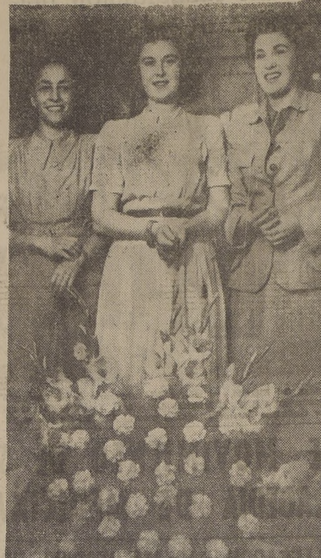
ELECCION DE REINA DE LA CASA DAVIS & CIA LTDA. — Enormo entusiasmo ha provocado la elección de la Reina de esta firma comercial...