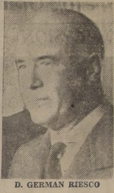
D. GERMAN RIESCO

WASHINGTON, 3.—(U. P.) —La Organización de Estados Americanos ha recibido el siguiente mensaje del Canciller chileno Germán Riesco: "Me permito felicitar a la Organización de Estados Americanos con ocasión de entrar en vigor el Tratado Interamericano de Asistencia Recíproca, instrumento que servirá para fortalecer los lazos que unen a los países del continente y para consolidar la paz en América." "Me alegra inmensamente poder informar a Su Excelencia que el Comité de Relaciones Exteriores del Senado de Chile, probó hoy la ratificación de este Pacto, y que mi Gobierno confía en transformarlo pronto en una ley de la República."