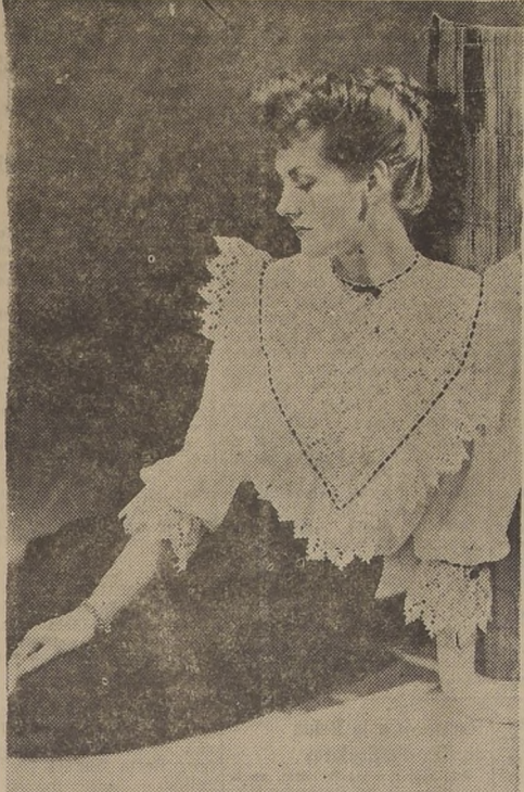
El renacimiento de la moda femenina se manifiesta en Londres en la boga de las blusas de bordado inglés, como la que aparece en el grabado.