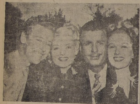
Las cuatro estrellas de "Mujer tentadora".

Una de esas películas especialmente reservadas para esta época de intensos calores es "Mujer tentadora" (When a girl beautiful) que Columbia Pictures presenta desde el miércoles próximo en la pantalla del Teatro Central. Y es que en realidad "Mujer tentadora", es una cinta que podría llamarse refrescante, ya que en ella, además de su argumento liviano y agradable, con un encantador romance musical, hay un despanpanante destile de hermanas gemelas, que lucen las más ligeras tenidas. Tienen a su cargo la responsabilidad de los papeles centrales en "Mujer tentadora" las encantadoras actrices Adele Jergens y Patricia White, junto al famoso bailarín Marc Platt y al cotizado actor Stephen Dunne, encabezando un conjunto de verdadera jerarquía.