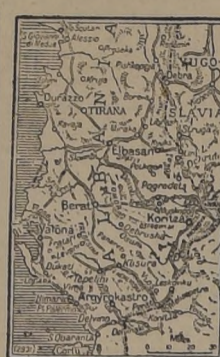
Drenovo, en la Albania meridional, son objeto de estadísticas regulares que acusan constante progresión...