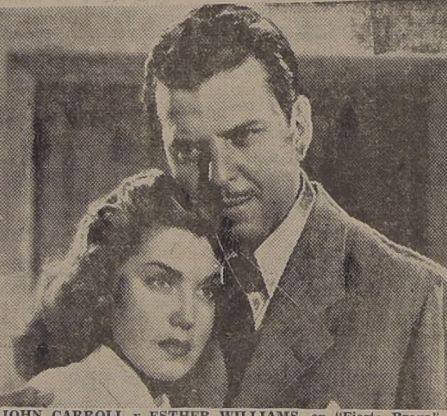
JOHN CARROLL y ESTHER WILLIAMS en "Fiesta Brava"