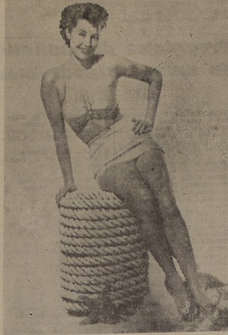
Florenz Ziegfeld, el famoso empresario de folies que glorificara la belleza de la mujer, dicen que era muy exigente para escoger las bellas que daban fama a sus revistas. Se dice que para seleccionar sus cualidades físicas, Florenz Ziegfeld usaba una tabla de medidas que todas las muchachas que militaban en sus famosos centros debían satisfacer. La tabla de Ziegfeld incluía un determinado peso y una determinada altura, aparte de ciertas medidas sobre el cuello, busto, cintura, caderas, muslos, pantorrillas y tobillos. Así, las muchachas de Ziegfeld, llamaban la atención del mundo