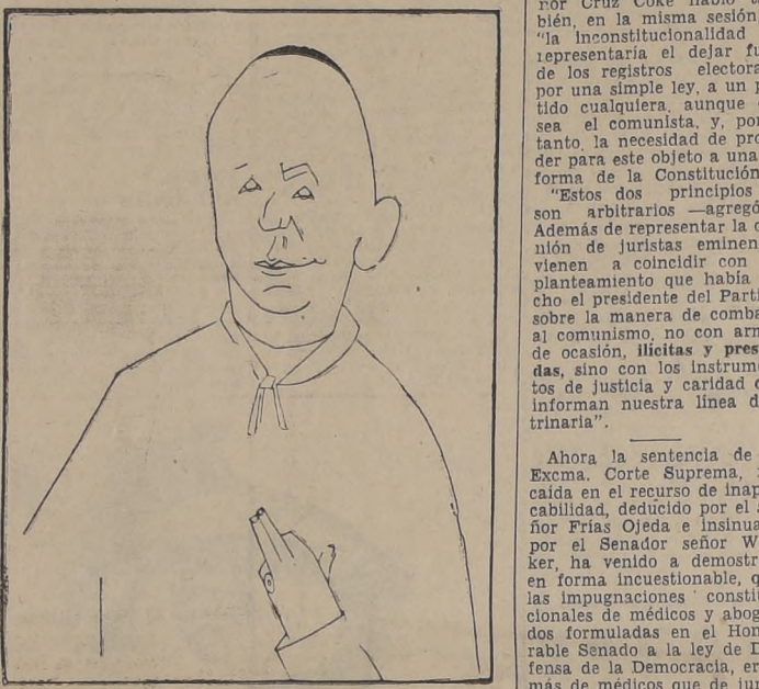
El Cardenal Joseph Mindszenty, que ha sido condenado a prisión perpetua por el Tribunal Supremo de Hungría.