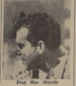
Fred Mac Murray