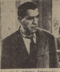
Esta es la última fotografía del misterioso Boris Karloff, quien anima el rol estelar de "El Reto"...