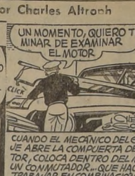
Por Charles Altroch