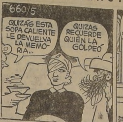
Por Charles Altroch