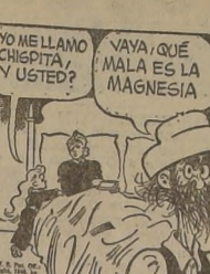
Por Charles Altroch