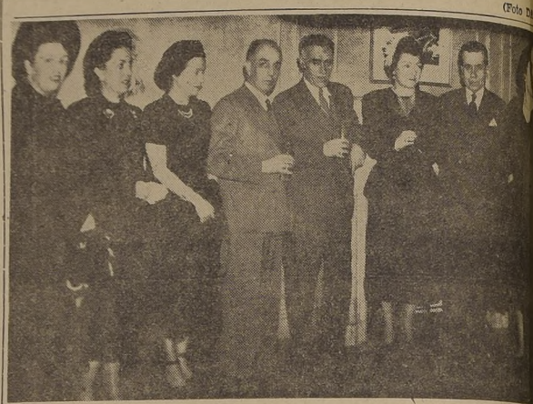
Parté de los asistentes al cocktail ofrecido en el Instituto Chileno-Norteamericano...