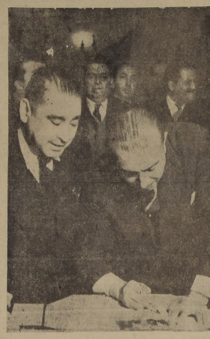
S. E. el Presidente de la República recibió en audiencia al director-proprietario de "El Regional", de Coquimbo...