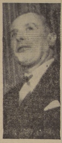
S. E. el Presidente de la República, cuyo discurso de hoy en Valparaíso es esperado con vivo interés en todos los círculos de ese puerto y de todo el país.