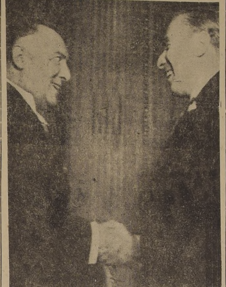
Presentamos dos instantáneas fotográficas de las ceremonias de la entrega de las cartas credenciales a S. E. el Presidente de la República por los nuevos Embajadores de México y Francia.