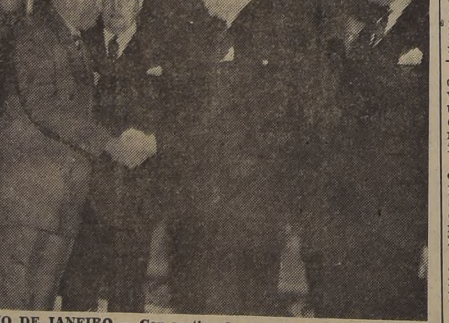
RIO DE JANEIRO.— Con motivo de su visita a los Estados Unidos de Norteamérica, el Presidente Eurico Gaspar Dutra, delega el mando presidencial en la persona del doctor Neru Ramos, copresidente de la República, a quien vemos en la foto, estrechando de la mano del Presidente Dutra. (Foto ACME).

Casi todos los observadores dan por sentado que en el asunto se incluyó en el último momento un acuerdo sobre el asunto será fácil el resolver el resto de la disputa.