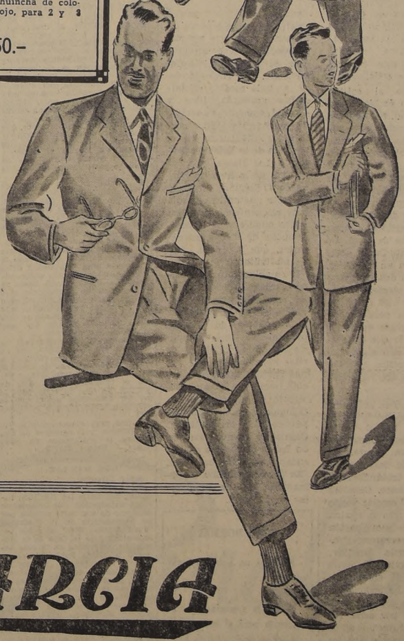
AMBOS, confeccionados con una fantástica selección de casimires, de pura lana, modelos: cruzados y derechos, colores unidos, todas las medidas, $ 1.950.-