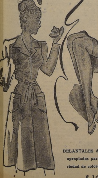
DELANTALES de brin jaspeado, apropiados para empleadas, variedad de colores y tamaños, c.u. $ 165.-