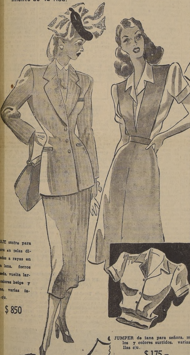
TRAJE sastre para señora en telas diseñadas a rayas en pura lana, forros de seda, vuelta larga, colores beige y plomo, varias tallas, c.u. $ 850

Ofrecemos durante 15 días una oportunidad, que no podrá repetirse. Necesitamos eliminar nuestros surtidos a cualquier precio, y para ello hemos rebajado en todos los departamentos sensiblemente el valor de todos los artículos