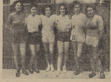
Con ocasión de celebrar su 5.º aniversario, el Instituto Pedagógico Técnico...