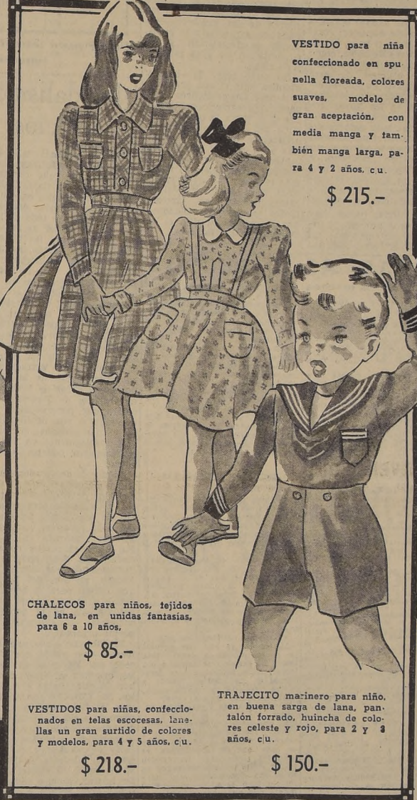
VESTIDO para niña confeccionado en spunella floreada, colores suaves, modelo de gran aceptación, con media manga y también manga larga, para 4 y 2 años, c.u. $ 215.-