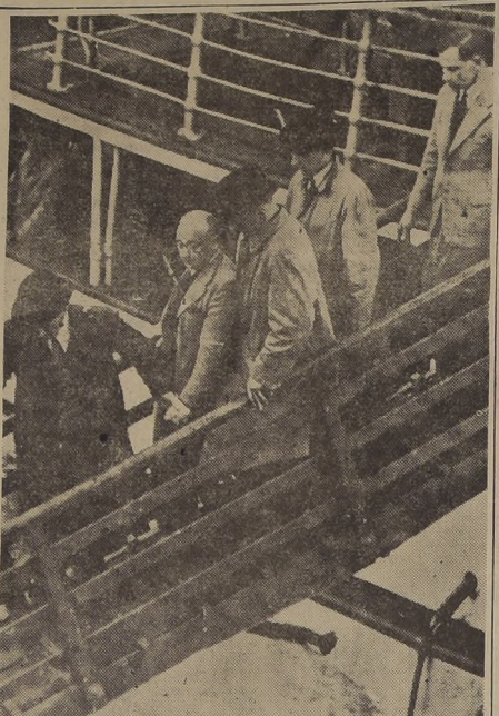
SOUTHAMPTON, Inglaterra.— El inspector-detective Bray, de la famosa policía Scotland Yard, camina delante de Gerhart Eisler (segundo de la derecha), señalado como el comunista norteamericano No. 1, que huyó de Nueva York, escondiéndose en el vapor polaco "Batory". Eisler, que estaba sometido a un juicio en Estados Unidos, gritó y pateó cuando se le sacó a viva fuerza del vapor; pero luego se tranquilizó y bajó calmadamente, rodeado por detectives británicos.