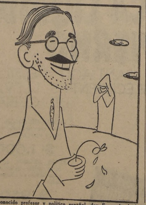
El conocido profesor y político español don Fernando de los Ríos, que ha fallecido en los Estados Unidos.