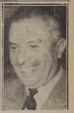
S. E. el Presidente de la República, Excmo. señor González Videla, a quien el Partido Radical acordó ayer por la unanimidad de sus convencionales, seguirle prestando plena colaboración en su labor de gobernante.

El segundo día de la XVII Convención Radical se caracterizó por la aprobación de un trascendental voto político y de la cuenta rendida por el CEN. La aprobación del voto y su aceptación unánime por la Comisión Política, primero, y por la Asamblea Plenaria, más tarde, presentan al radicalismo absolutamente unido, por la primera vez en la historia de sus Convenciones, en torno a un claro pensamiento que responde plenamente a la responsabilidad que el partido tiene como colectividad de Gobierno y como tienda política del Primer Mandatario de la Nación.