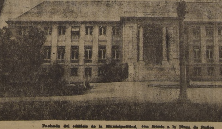
Fachada del edificio de la Municipalidad, con frente a la Plaza de Ñuñoa

DEPARTAMENTO DE DEFENSA MUNICIPAL.— Informes de carácter legal, 176; Reglamentos dictados y Ordenanzas modificadas, 6; juicios de expropiación pendientes: 6; actos de apercibimiento extrajudicial: 2; escrituras públicas sobre expropiaciones, cesiones de calles, compraventas para la Población de Empleados Municipales, construcción de la Población de Obreros Municipales, construcción de los hornos crematorios, etcétera, 61.