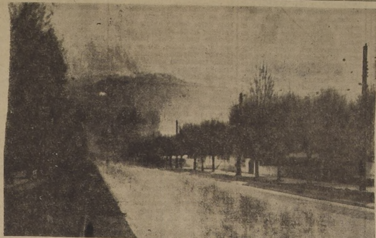
La pavimentación integral de la comuna tal como se ha hecho en la Avenida Irarrázaval, es una aspiración fundamental de la Alcaldía

Otra parte expropiada correspondiente a Diagonal Nueva Ñuñoa, que ya está habilitada en su mayor extensión. Esta nueva vía tendrá su punto de partida en el Estado Nacional y terminará en José Domingo Cañas.