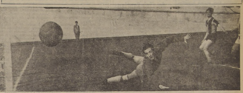
EL GOL DE DUNEVICHET. Aprovechando su rapidez, el eficiente forward transandino estudió a la defensa...