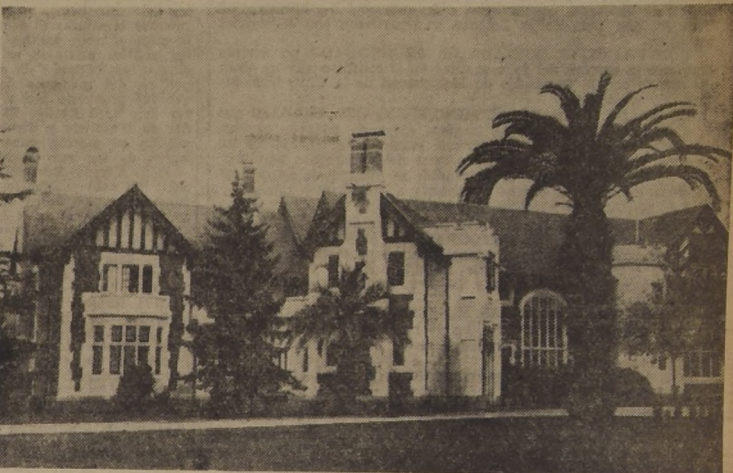
Frontis del Liceo Experimental "Manuel de Salas", en cuya Escuela Anexa funciona el Liceo Comunal