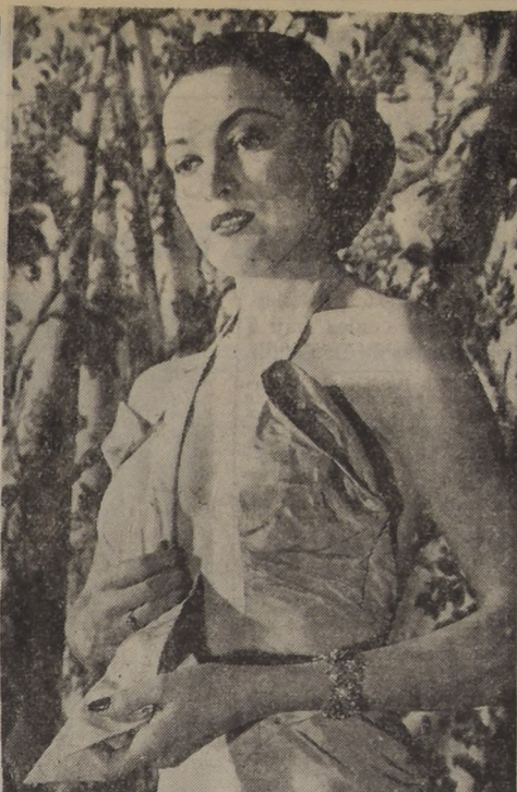
SAN FRANCISCO, California.—El talante, como diseñadora de la cantante Julie Wilson, le permite a esta belleza, adelantarse a los censores de la televisión. Aquí demuestra cuán fácilmente puede ella cambiar el vestido que ella misma diseñara para un espectáculo de televisión, colocando un trozo de género alrededor de su cuello y dejarlo caer negligentemente sobre su busto, como si se amarrara una corbata.

LAKE SUCCESS, 3. — (U. P.) — El Secretario General de la NU, Trygve Lie, declaró a la prensa que ha escrito a los Ministros de Relaciones Exteriores de los 59 Estados miembros de la organización mundial, para pedirles que ayuden a reunir fondos extras para los refugiados de Palestina. Dijo que se da ayuda a 940,000 refugiados, y que "el programa debe continuar por otro año". Expresó Trygve Lie: "En un principio se calculó la ayuda para 500,000 refugiados con un presupuesto de 32 millones de dólares, y un programa que terminaría el 31 de agosto de este año".