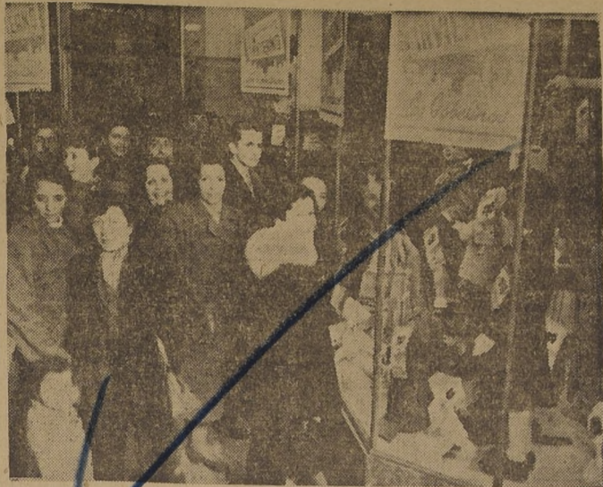
Un aspecto de la extraordinaria concurrencia, que ayer visitó LOS GOBELINOS atraída por la excelente calidad y los precios rebajados de la mercadería de sus 18 Departamentos, en la Liquidación de Invierno

Impresionantes rebajas de cada uno de sus departamentos, iniciadas ayer en la mañana. LOS GOBELINOS su tradicional Liquidación de Invierno, con el objeto de renovar su stock de mercaderías que caduca a fines de primavera y verano. La concurrencia desbordante principalmente por la calidad de nuestra sociedad y niñas de todo el país, durante todo el día, rebajas en forzosos rebajas en forzosos precios y por la inmensidad de todo cuanto se exhibe en LOS GOBELINOS. Se cuenta con un personal especial de atención y empujadas que atraen a la gente gentil, en una rápida de siempre a la tienda. En otra parte, las 17 vitrinas de LOS GOBELINOS exhibieron ofertas selectas de departamentos, uno de los departamentos, principalmente la de Ahumada, las vitrinas de Ahumada se mostraron artífices en damas y caballeros, esmeradamente camisería, sastretería, camisería, sastretería, etc. También hubo rebajas en "vendido" cada artículo figura con un precio, sin ardo o motivos. El público recorrió con interés las vitrinas, imponiendo ofertas excepcionales, en modas de señoras, confección para caballeros, confección de señoras, camisería, sastretería, etc. También hubo rebajas en "vendido" cada artículo figura con un precio, sin ardo o motivos.