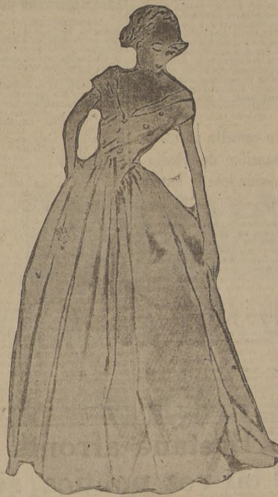
Modelo de Jacques Griffe, muy apropiado para la jovencita que recién va a bailes. La falda, muy amplia, se recoge en el corsage, que termina en dos puntas en el delante, y que lleva un gran decolleté y adornos de strass.