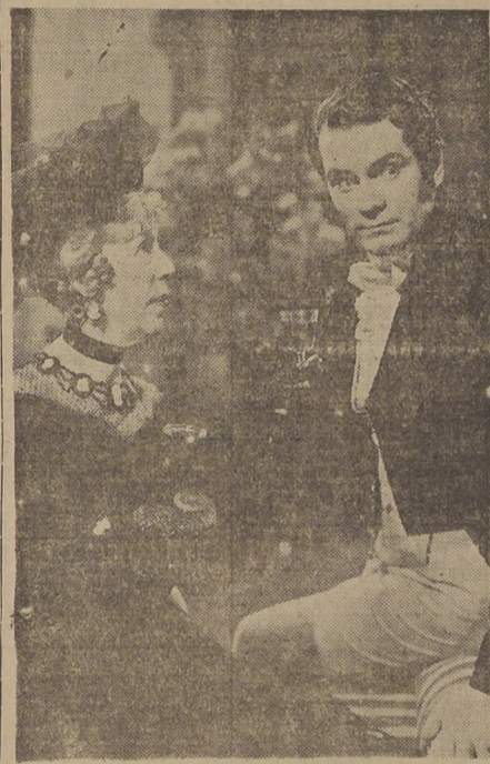
Laurence Olivier en una escena de la película "Más fuerte que el orgullo"

EL AMOR ES "MAS FUERTE QUE EL ORGULLO" DECLARA GREER GARSON