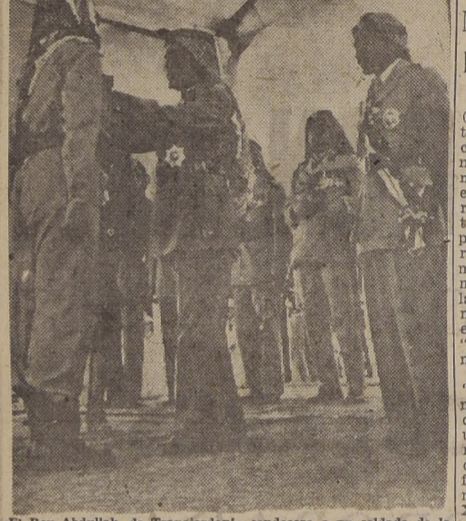
El Rey Abdullah, de Transjordania condecora a un soldado de la Legión Árabe, durante una revista militar en Aman. — (The Illustrated London News).

Una nota especial en la contraportada dice: "La Gaceta del clero católico es la Gaceta Oficial de todo el clero católico. Las noticias publicadas en la parte oficial de la Gaceta son oficiales y obligan al clero. Todas las otras instrucciones publicadas fuera de la Gaceta, del clero católico, no tienen obligación legal alguna. Por tanto, las parroquias—después de leer la Gaceta, deben archivarla en lugar seguro y producir en caso de inspección".