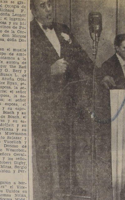
Seguendo la Cadena de los Grandes Programas de Sídra Doña Francisquita, el sábado pasado hizo su última presentación ante los micrófonos de C.B. 57 Radio Nacional de Agricultura el popular intérprete del cancionero latinoamericano, Alfonso Ortiz Tirado. — El numeroso público que asistió al Auditorio de dicha radio aplaudió entusiastamente al querido artista mexicano que nos visita, brindando finalmente con la popular Sídra Doña Francisquita, auspiciadora de estos programas