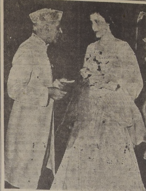
El Pandita Nehru, Primer Ministro del Indostán, departe cordialmente con lady Nye, esposa del general Archibald Nye, Alto Comisionado inglés, durante la recepción ofrecida recientemente en la Casa de Gobierno en Nueva Delhi.