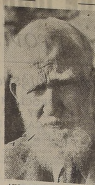
AYOT SAINT LAWRENCE, 26.— (U. P.)— El famoso dramaturgo Bernard Shaw, tuvo hoy una doble celebración, su nonagésimo tercer cumpleaños...