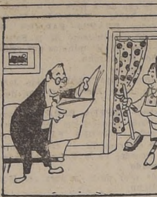
SE AUMENTARON LAS DIETAS DE DIPUTADOS A $4.000