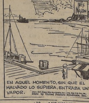
EN AQUEL MOMENTO, SIN QUE EL MALVADO LO SUPIERA, ENTRABA UN VAPOR.