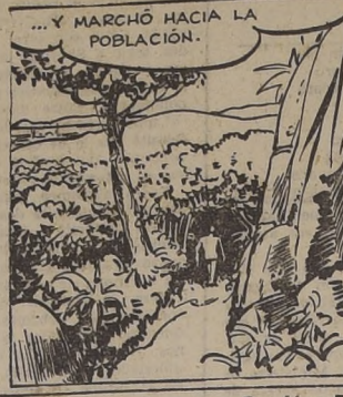
... Y MARCHÓ HACIA LA POBLACION.