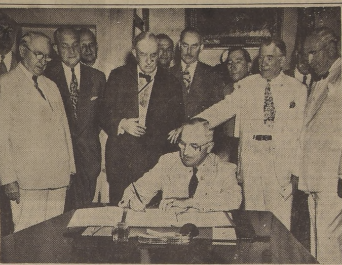
TRUMAN RATIFICA EL PACTO DEL ATLANTICO. — WASHINGTON. — En una ceremonia realizada en la Casa Blanca, el Presidente Truman ratificó formalmente el Pacto del Atlántico del Norte al firmarlo en presencia de su Gabinete y de líderes del Congreso Nacional.

Una gran industria de aceites será instalada gracias al intenso cultivo del olivo, que se hará en las Vegas de La Serena, cuya desecación en la parte sur ya está llevando a efecto con todo éxito. La expropiación de este sector pantanoso fue llevada a efecto por el Ministerio de Tierras y Colonización.