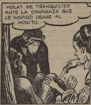
MOLAT SE TRANQUILIZO ANTE LA CONFIANZA QUE LE INSPIRO DEANE AL MONITO.