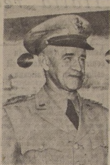
El general BRADLEY

Los tres jefes comparecieron ante el citado comité para exponer al Congreso para que apruebe rápidamente el Plan Truman, de suministrar armamentos a los países de la Europa occidental, por un total de 450 millones de dólares. Bradley reveló que los planes de defensa de Europa occidental determinan que solamente los Estados Unidos tendrán la responsabilidad de los bombardeos estratégicos. Los demás signatarios del Pacto del Atlántico se declararán de preferencia a la defensa terrestre y aérea, así como de los ataques aéreos a corta distancia. Los jefes militares salieron en compañía del mayor general J. M. Gruenther, director del Estado Mayor mixto en el avión personal del Presidente Truman. El avión "Independence" despegó a las 5 y 45, con destino a Frankfurt. El grupo de oficiales estará diez días en Europa, entrevistándose con los dirigentes militares de las demás naciones del Pacto del Atlántico.