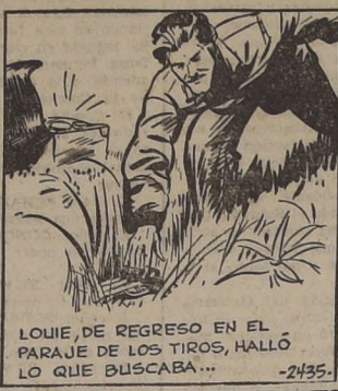
LOUIE, DE REGRESO EN EL PARAJE DE LOS TIROS, HALLO LO QUE BUSCABA...