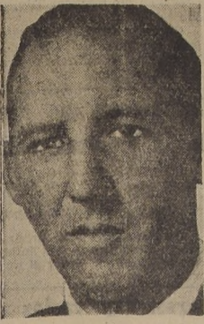
El Canciller BRAMUGLIA

BUENOS AIRES, 12 (U. P.).— El Ministro de Asuntos Exteriores, Roberto Ares, confirmó que el Ministro de Relaciones Exteriores, Juan Atilio Bramuglia, renunció, y no le aceptará la renuncia. En relación con otros ministros, Ares insinuó que no renunció, al decir que la situación (la de los ministros) no ha cambiado, en esferas bien informadas se dijo que Bramuglia, que ha renunciado, había presentado su renuncia por esas esferas. Dijeron que ha estado en su residencia en San Vicente, de Buenos Aires, restando a la casa de Gobierno el sábado y que quizás, pudieran ocurrir acontecimientos.