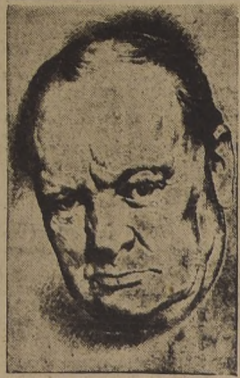
WINSTON CHURCHILL, quien desarrolla gran actividad en el Parlamento de Europa.

Churchill dijo entonces, que el Consejo de Europa recientemente constituido y ante cuya Asamblea Consultiva, él es delegado, debe contribuir a unificar a Europa dividida. Agregó: "En esa forma no sólo prepararemos el camino hacia la prosperidad y el renacimiento europeo, sino que también, nos protegemos del peligro de ser arrollados por cualquier forma de tiranía totalitaria, ya sea la odiosa dominación nazi o cualquier otra forma de despotismo". "Estoy seguro que tenemos capacidad y también voluntad para surgir de los peligros que nos confrontarán. Esperamos y trabajamos por una era de paz y abundancia, en que la riqueza y el genio ilimitado de Europa, harán de ella nuevamente la fuente de inspiración para el mundo.