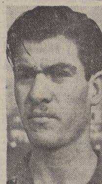
AVANCES.— Audax no lo coloca siempre en su cuadro de honor, aunque debiera ser titular.