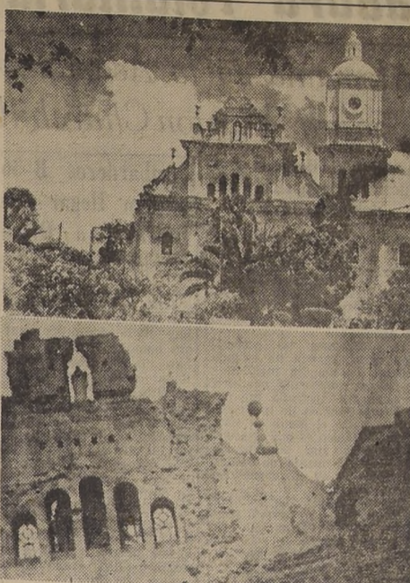
La Catedral de Ambato, antes y después del terremoto que asoló una parte de la meseta andina del Ecuador. Bajo las ruinas de este hermoso templo colonial, perecieron 60 niños y un sacerdote.

Acheson contestó que él cree que "continúan", aunque no sabía si eso significa que han sido "reanudadas".