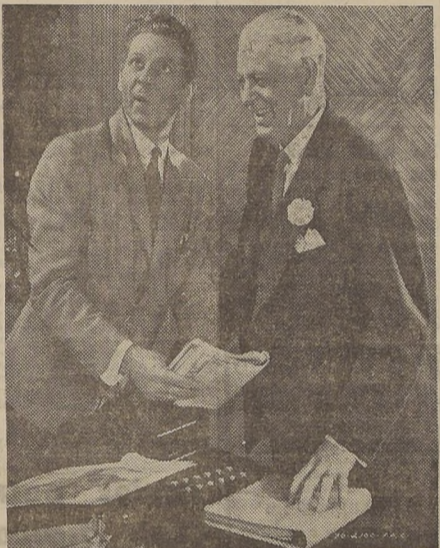
En el grabado aparece Danny Kaye en una de sus innumerables situaciones graciosas, las que serán demostradas hoy en el cine Central.

Por primera vez en la historia de Tarzán, un equipo cinematográfico completo se trasladó a las selvas vírgenes de Guatemala, para filmar la extraordinaria película “Las nuevas aventuras de Tarzán” que se estrenará el próximo jueves en el Rotativo Miami. Una caravana de camiones cargados con miles de toneladas de películas, cámaras, equipos de sonido, vestuario, tiendas de campaña, alimentos, medicinas, y personal técnico y artístico, se internó en lo más espeso de la selva