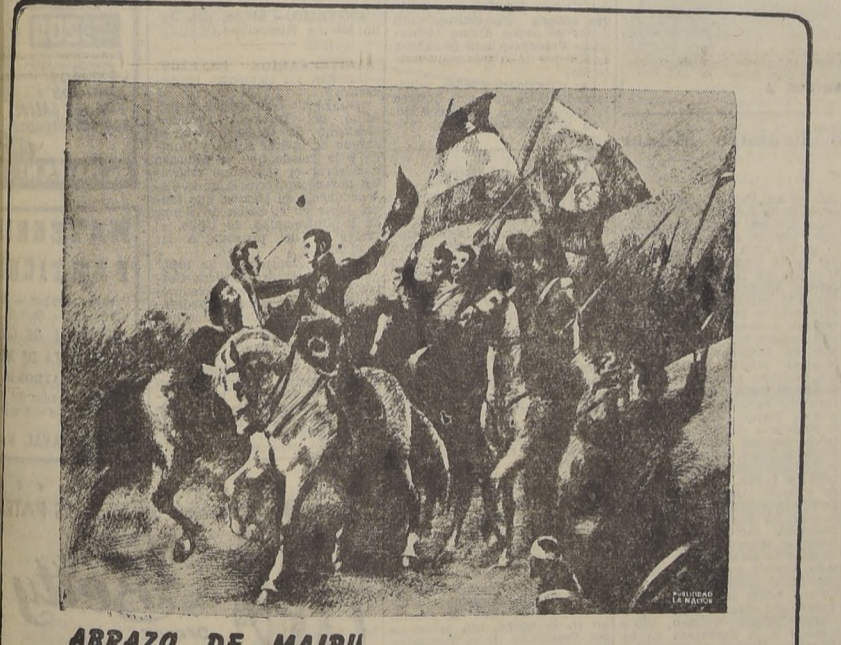
ABRAZO DE MAIPU. A pesar de estar gravemente herido, nadie puede detener en Santiago a D. Bernardo O'Higgins, quien, seguido por el pueblo, se dirige hacia los campos de Maipú...