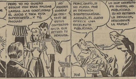
Por Brent and Wells