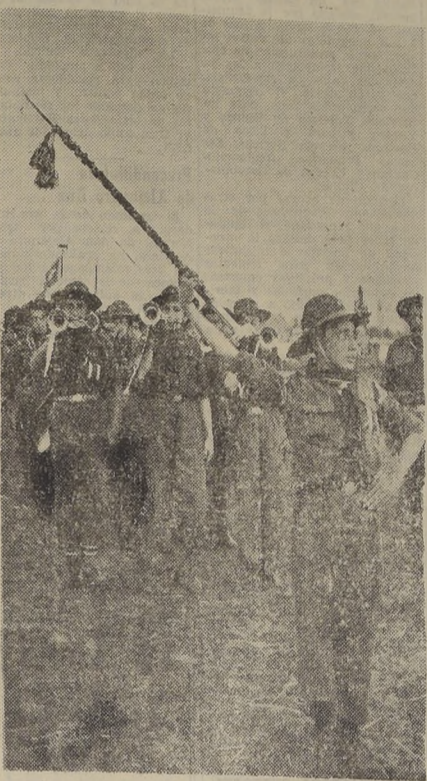
Los boy-scouts de Sewell, fueron sorprendidos ayer por LA NACION, mientras se preparaban para el desfile de hoy, que partirá a las 11 horas desde la Plaza Baquedano, hasta el monumento a O'Higgins.

terio de Defensa Nacional, Subsecretaría de Guerra, por asuntos que le interesan.