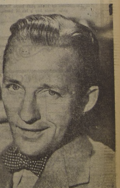
El cantante y actor Bing Crosby está siendo utilizado para representar ante el público aficionado al cine, a una serie de estrellitas de la Paramount, en la forma que por primera vez se utilizó en la cinta "Riding High".

pués que la señorita Wyman regresó de Inglaterra. —Greer Garson va a beneficiarse con el cambio de título en la película que ha terminado recientemente con Errol Flynn. La película en vez de llamarse "The Forsyte Saga", como la novela de que ha sido sacada, se denominará "That Forsyte Woman". —El productor Sol Lesser, que se hizo famoso con la serie de Tarzán, está muy alegra por el hecho de que 40.000 pies de película en color Kodachrome, filmadas en Sud América para una producción, fueron despachadas desde wood sign el mismo sistema.