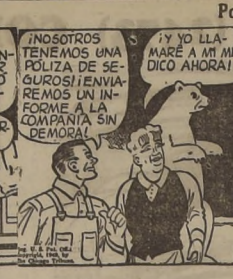
Por Charles Altrop

No 136.—CADUCIDAD DE CONTRATO DE EMPLEADO DOMESTICO CONSULTA: Desde hace 3 meses, más o menos, trabaja en mi casa, como cocinera, una empleada con un sueldo de $ 800 mensuales. Nosotros so-