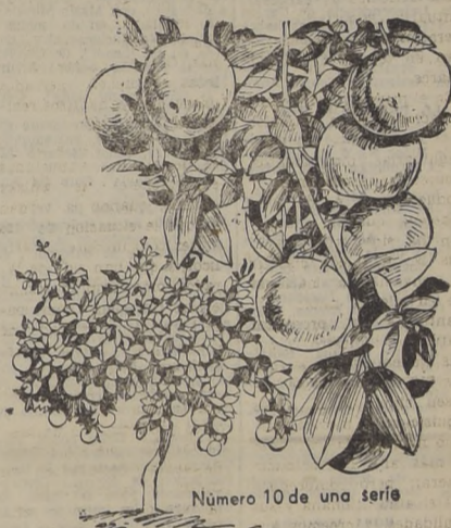
Número 10 de una serie