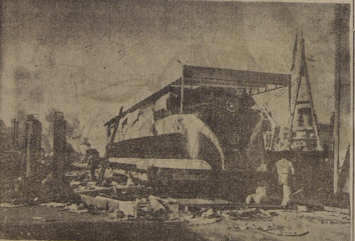
Ya armados los bogies, la grúa flotante ha depositado el cabina controlador de la locomotora "Westinghouse", cuyo peso es de 110 toneladas. En el puerto de Talcahuano al realizar esta delicada faena los obreros chilenos demostraron una vez más, su reconocida habilidad manual

Han concurrido a recibirla a nuestro primer puerto militar, autoridades de los Ferrocarriles y de Salesco Ltda.