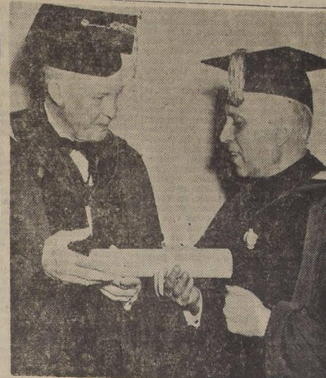
NUEVA YORK.—El presidente de la Universidad de Columbia, general Dwight D. Eisenhower, entregando los diplomas que designan al Primer Ministro de la India, Jawaharlal Nehru, Doctor Honoris Causa.—(Foto ACME).

El Sindicato de Obreros Marítimos del Canadá declaró que continuará la lucha para recabar los salarios atrasados y las condiciones de trabajo por las cuales se declaró la huelga.