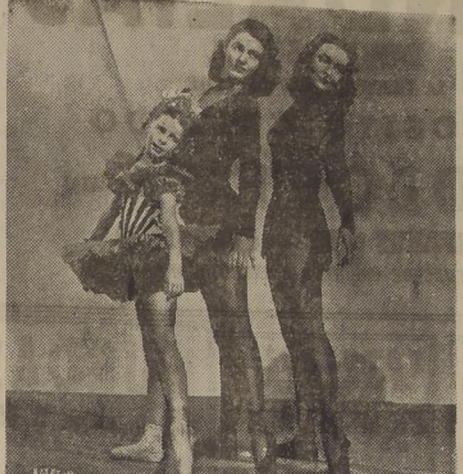
MARGARET O'BRIEN, CYD CHARISSE Y KARIN BOOTH, animan un cuadro de "La danza inconclusa".