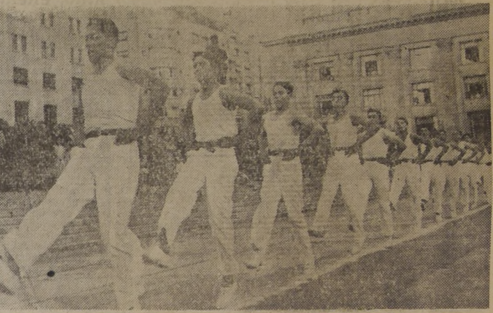
Parte de los alumnos del Politécnico de San Bernardo, que ayer hicieron una lucida presentación gimnástica en la Plaza de la Constitución, en la que demostraron el alto grado de preparación física y amenidad por la banda del establecimiento. También un conjunto de la Escuela N.º 12 de San Bernardo. Los ejercicios fueron muy aplaudidos por numeroso público.