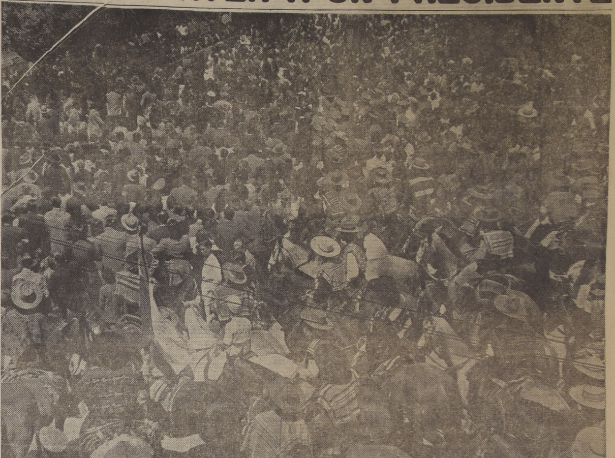
En pintorescos grupos los "huasos" de la zona agrícola de Talca se reunieron en la Plaza de Armas, para oír las palabras del Jefe del Estado, quien en esta oportunidad definió con energía los problemas que preocupan al país.