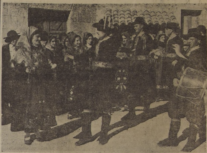
En los primeros días del próximo mes de noviembre arribará a Valparaíso el vapor "Monte Aya-la", que trae desde España un clásico conjunto artístico de "Coros y Danzas" representando a distintas provincias de España, en sus típicas costumbres y trajes regionales. Aquí adelantamos una estampa de León, con sus simpáticas "maragatas" en sus danzas típicas

Un octavo hijo varón, perteneciente a un hogar de once niños, fué apadrinado ayer por S. E. el Presidente de la República, en la Iglesia de San Saturnino, en la Plaza Yungay.