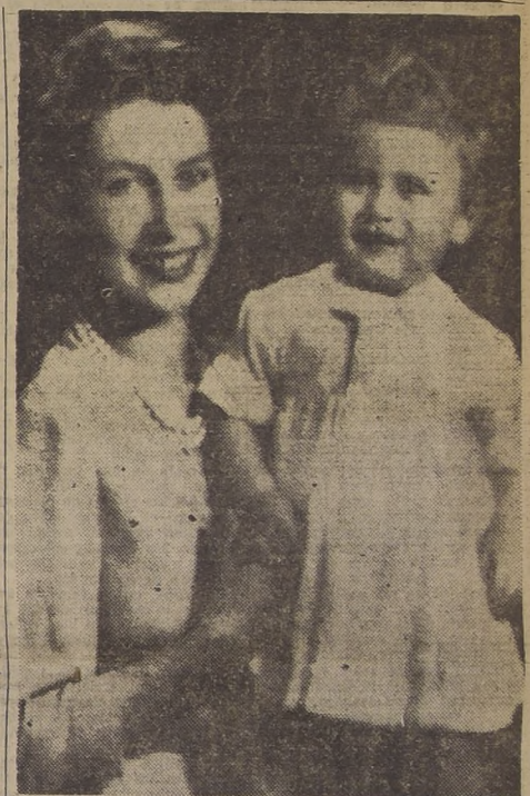
LONDRES.—La Princesa Elizabeth se retrata con su hijo, el Príncipe Carlos, al cumplir un año de edad, el 14 de noviembre. Su padre es el Duque de Edimburgo. El Príncipe Carlos es ya popular en su patria, pues el pueblo lo llama ahora el "Bonnie Prince Charlie" (el bonito príncipe Carlitos).

"PUEBLO DE LOS ANGELES: Esta imponente manifestación (PASA A LA PAGINA 2)