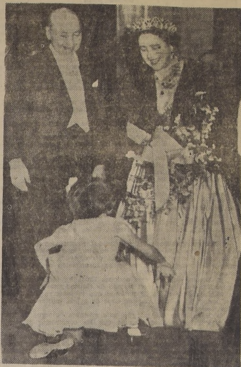
La Reina Isabel, de Inglaterra, recibe un simpático homenaje de un niño durante su reciente visita a Escocia.