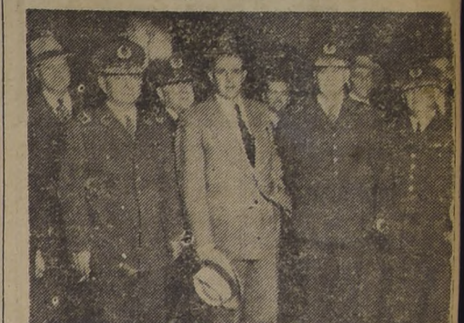
Con motivo de exhibirse en privado en el cine Real "La calle sin nombre" nuestro reportero gráfico tomó esta vista, en la que aparecen el Director General y Subdirector de Carabineros, actos jefes de esa institución y otras personalidades, que tuvieron frases de elogio para este film que la 20th Century Fox estrenará el martes en la sala de la calle Compañía.