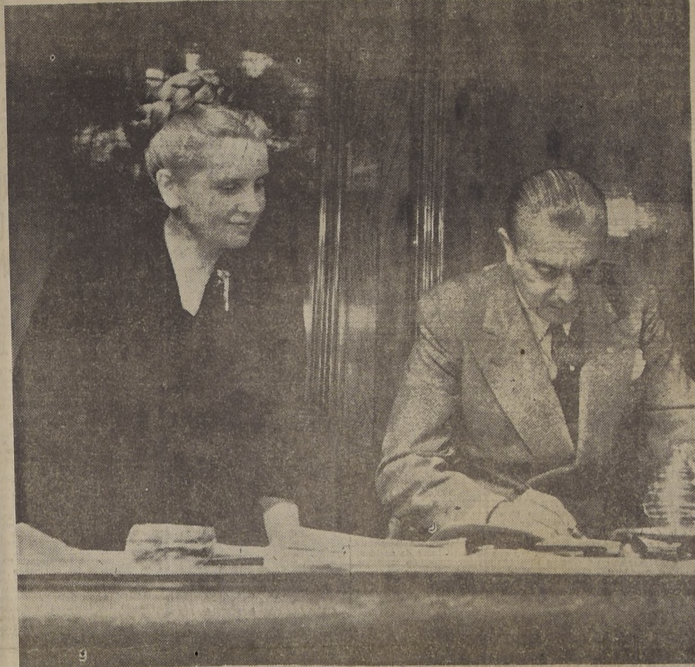
El Excmo. señor Gabriel Videla, en el momento en que firma el Mensaje al Congreso, por el cual se otorga una subvención anual de 45 millones de pesos a la Fundación de Casas de Emergencia que lleva su nombre, y que preside su distinguida esposa, que presenciará el acto con íntima complacencia. Con esos fondos será posible construir casas de madera, para terminar en un lapso de cinco años, con las actuales "poblaciones callampas".

S. E. firmó el mensaje al Congreso; terminarán las poblaciones callampas