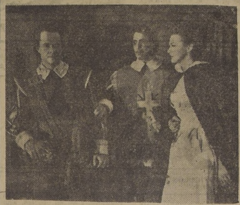
En esta escena aparecen Larry Parks y la bella Marguerite Chapman.

Justificado interés ha despertado en todos los círculos el anuncio de que, los Teatros Santa Lucía y Continental exhibirán desde el martes próximo, simultáneamente, la extraordinaria producción fílmica del sello Columbia, "La espada vengadora". Y este entusiasmo se fundamenta en los antecedentes que existen de esta grandiosa película que reúne en exceso todos los factores para alcanzar un éxito sostenido. Desde luego, su base argumental es de un interés innegable ya que se relatan fantásticas aventuras desarrolladas