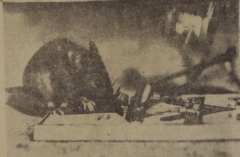
EL MISMO SE FOTOGRAFIO AL BUSCAR LA MUERTE DE HARRISONVILLE (Missouri). Este hombre ratoncita se comió un bocadito de queso; él mismo tomó su propia fotografía, y en una fracción de segundo más tarde, pereció cogido por la trampa. El fotógrafo de ACME conectó de tal manera que trampa con el disparador de su cámara, de tal manera que cuando el ratón pisó la trampa, movió el disparador de la cámara tomándose una fotografía en 1/400º de segundo. El objeto que se ve en el aire, es un peso que chocó el fotógrafo para hacer menos veloz la acción del resorte de la trampa.